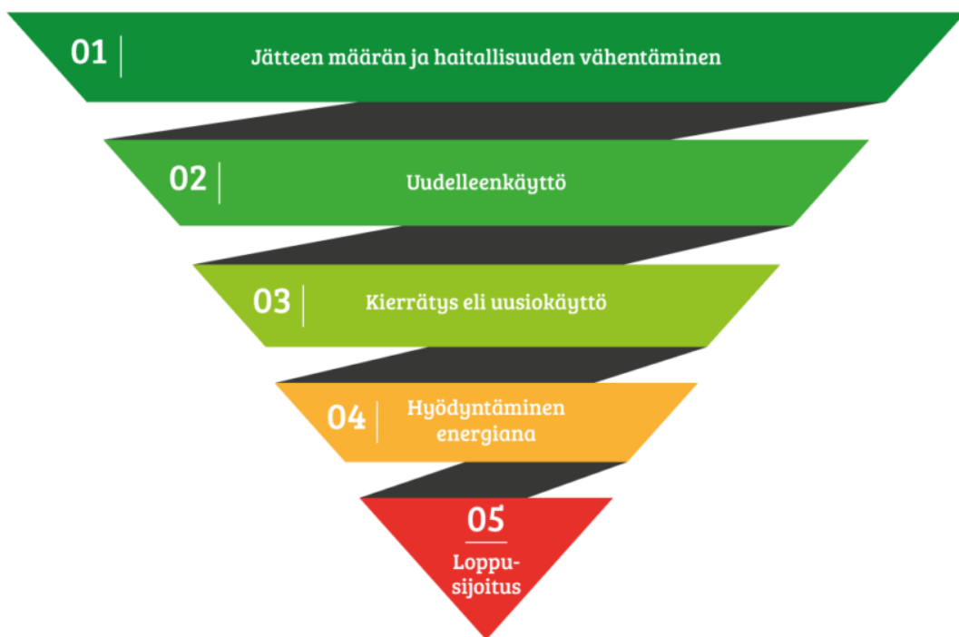
Kuvio 1, Jätehierarkia (Etappi)