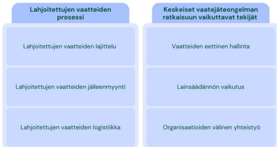
Kuvio 3, Havainnollistava kuvio aineiston ryhmistä.

Tässä luvussa tulen esittelemään aineistosta löytämiäni tuloksia ja liitän niitä kirjallisuuskatsauksessa käsittelemääni aikaisempaan kirjallisuuteen ja tutkimuksiin. Tulokset tulen käymään läpi aineiston analyysissä syntyneiden ryhmittelyjen kautta (Kuvio 3). Ensimmäiseksi käyn läpi lahjoitettujen vaatteiden prosessia, jossa tarkemmin keskityn lahjoitettujen vaatteiden lajitteluun, logistiikkaan sekä jälleenmyyntiin. Tämän jälkeen siirryn käsittelemään vaatejäteongelman ratkaisuun vaikuttavia tekijöitä, jotka ovat aineistoni mukaan organisaatioiden välinen yhteistyö, lainsäädäntö ja vaatteiden eettinen hallinta.