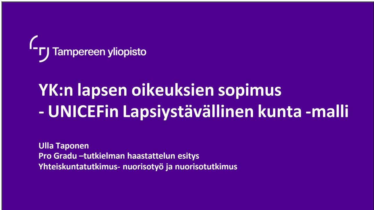
Kuva 1. YK:n lapsen oikeuksien sopimus – UNICEFin Lapsiystävällinen kunta -malli