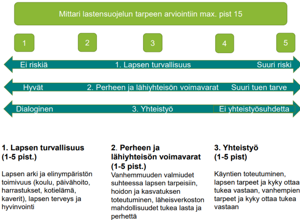
Kuvio 2. Työväline lastensuojelun tarpeen arviointiin (Alatalo ym. 2019, 19).