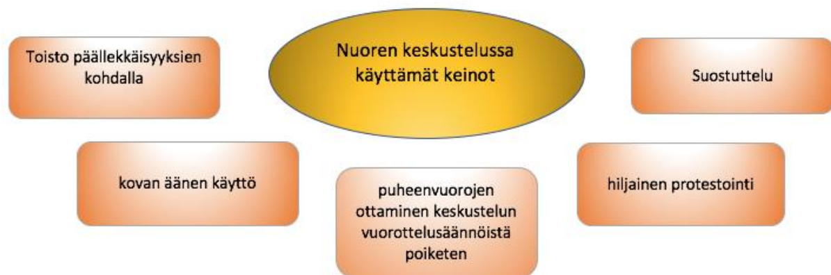
Kuvio 1: Nuoren käyttämät keinot kuulluksi tulemisen varmistamiseksi

Nuoren kuulluksi tulemiseen vaikuttaa myös moni taustamuuttuja, esimerkiksi aiempi suhde paikalla olleisiin henkilöihin tai jotkin henkilökohtaiset ominaisuudet, kuten mahdollinen jännittäminen tilanteessa. Tutkielmassa ei pyritä kuvaamaan kaikkia niitä asioita, jotka nuoren kuulluksi tulemiseen vaikuttavat, vaan tarkastelemaan sitä, miten kuulluksi tuleminen rakentuu paikalla olevien henkilöiden vuorovaikutuksessa. Tutkielmassa ei myöskään tehdä päätelmiä nuoren kuulumisen tunteesta, vaan tarkkaillaan nuoren kuulumisen mahdollisuuksia institutionaalisessa tapaamisessa.