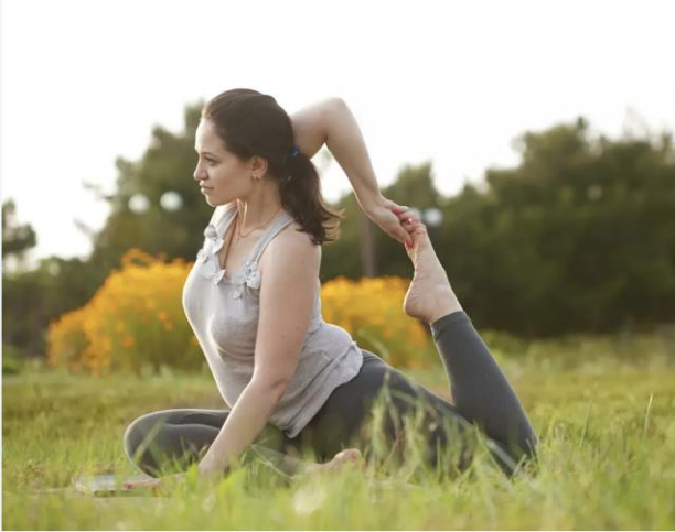
Moni tarvitsee tietoista stressitasojen madaltamista – hyvä keino on esimerkiksi jooga.