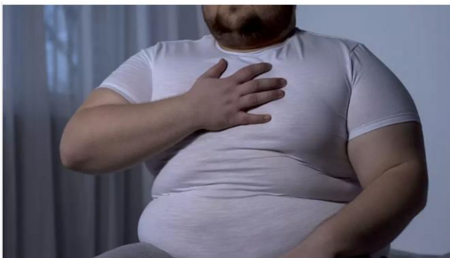
Tutkijoiden havainto voi selittää sitä, miksi ylipainoisten ja lihavien koronaireet ovat usein pahoja.

Lihavuutta representoitiin myös sairauteen ja lääkkeisiin liittyvällä kuvastolla. Sairausdiskurssi syntyi kuvista, jotka kertoivat lihavuuden olevan epäterveellistä ja aiheuttavan kipua ja sairautta. Lihavuuden voi tulkita kuvista sairautena, jota pitää lääkittää, tai sellaisena tilana, joka tuo sairauksia, joita pitää lääkittää tai joiden vuoksi joudutaan sairaalaan.