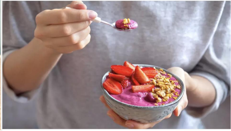
Kuva 2. Lähes aina kun syö, kasviksia, hedelmiä tai marjoja pitäisi olla mukana nyrkin kokoinen annos.

Tällainen tyyli yhdistyy perinteiseen naistenlehtien laihdutusdiskurssiin, jossa kehonmuokkaus liitetään juuri naisten kiinnostuksenkohteeksi (Harjunen 2018). Kuvista voikin päätellä, että lihavuuden tulisi aiheena kiinnostaa erityisesti naisia, sillä heidän on muita sukupuolia tärkeämpää näyttää laihoilta ja kauniilta, ja samalla levittää kauneutta ja siisteyttä ympärilleen.