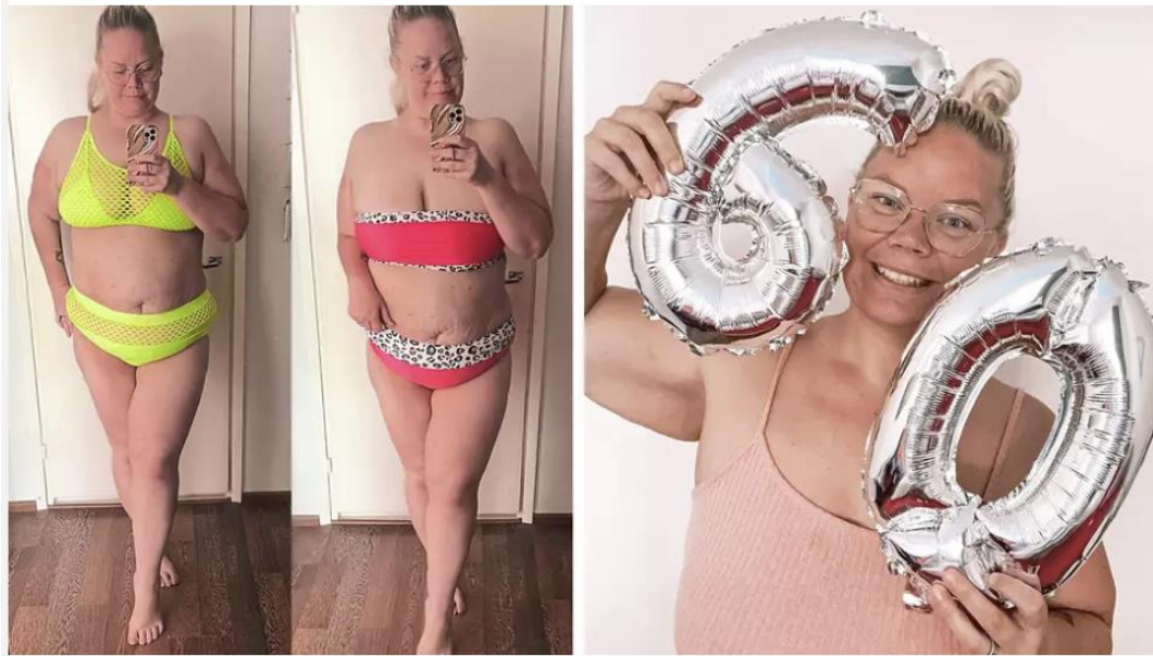
Nyt Henriikan vaatekaapista löytyy myös muutama pari bikineitä.