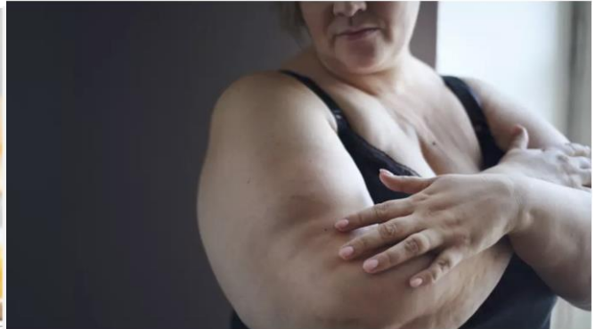
Suomessa on ollut jo pitkään satojatuhansia ihmisiä, jotka olisivat hyötäneet laihdutuslääkkeistä, yllilääkäri sanoo. KUVA: COLOURBOX

Kuva 4. Smoothie on vaivaton tapa varmistaa, että päivän minimiannos kasviksia, marjoja ja hedelmiä tulee kuitattua (Colourbox 2022).