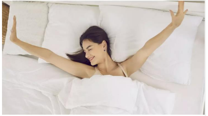
Kunnon yöunien apu painonhallinnassa on tieteellisesti todistettu.