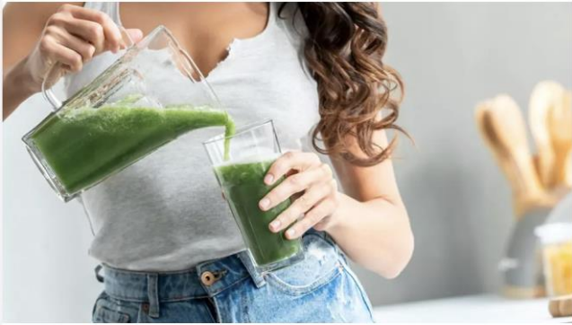
Smoothie on vaivaton tapa varmistaa, että päivän minimiannos kasviksia, marjoja ja hedelmiä tulee kuitattua. KUVA: COLOURBOX

Kuva 4. Smoothie on vaivaton tapa varmistaa, että päivän minimiannos kasviksia, marjoja ja hedelmiä tulee kuitattua (Colourbox 2022).