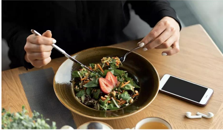
Kuva 1. 16:8-mallin etu on se, että siinä syödään joka päivä kunnolla.