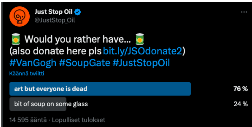
Kuva 3. Just Stop Oilin tekemä Twitter-kysely (Just Stop Oil 2022j).