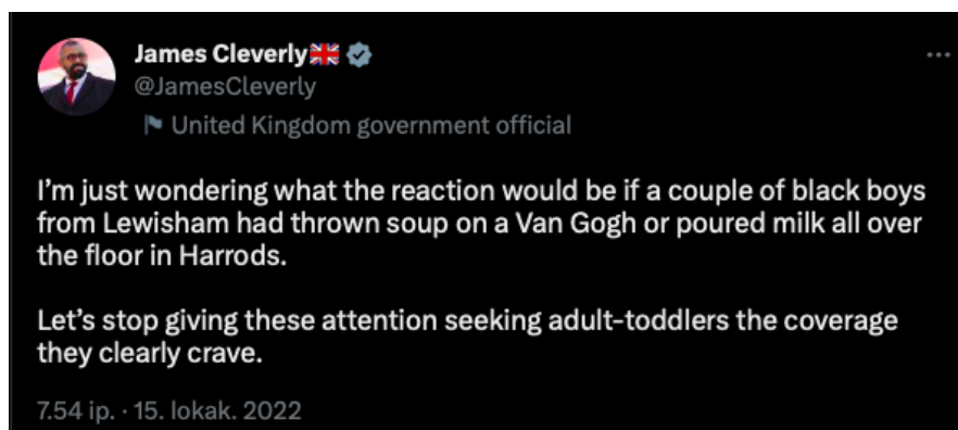
Kuva 5. Ulkoministeri James Cleverlyn twiitti Auringonkukista (Cleverly 2022).

Lokakuu oli erityisen aktiivinen kuukausi järjestölle. Just Stop Oil teki kampanjan, jossa kuun jokaisena päivänä tehtiin häiritsevää aktivismia Lontoossa. Tällöin toimintaan kuuluivat erilaiset tahrimiset. Konservatiivisten ajatushautomoiden, New Scotland Yardin, Harrodsin, Rolexin, valtiovarainministeriön, sisäministeriön, MI5:den, News Corpin, merkkiautoliikkeiden ja pankkien julkisivut tahrattiin oranssilla maalilla. Aktivistit kakuttivat myös kuningas Charlesin patsaan Madame Tussaudin vahakabinetissa. Myös Auringonkukat -tilanne tapahtui osana tätä protestien sarjaa 14.10.2022. (Emt.)