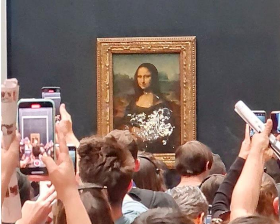
Kuva 2. Mona Lisa kakutuksen jälkeen (Reuters 2022a).

ja jakanut ruusuja paikalla olleille. Pyörätuoliasiakkaat pääsevät muita vierailijoita lähemmäs taulua jotta näkisivät sen, ja tekijä hyödynsi tätä toimintatavassaan. Samalla tuntemattomaksi jäänyt tekijä piti puheen, jossa kertoi motiivikseen ilmastokriisin. Hän oli vedonnut paikalla ollutta yleisöä miettimään maapalloa, jonka ihmiset tuhoavat. (Hoffman 2022; MTV Uutiset 2022; Palumbo 2022.)