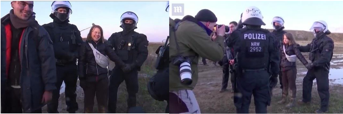
Kuva 6. Greta Lützerathissa (Powell 2023).

yhteiskuntamme on niin pinnallinen - kaikki menee niin lujaa ja oravanpyörä pyörii, ja Greta koki pudonneensa tästä kelkasta. Koululakon perustaminen ja aloittaminen sai Gretan kuitenkin ymmärtämään, että on paljon asioita, joiden puolesta elää ja, joita voi yrittää parantaa itsensä näivettämisen sijasta. (Skavlan 2019; Thunbergit 2019.)