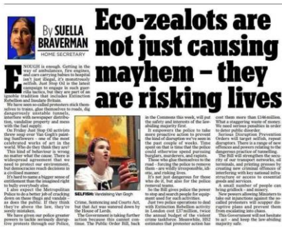
Kuva 7. Just Stop Oilin kirjeenvaihtoa sisäministerin kanssa. (Just Stop Oil 2022m).

The time to stand by has passed, stand with us on the streets, with our supporters in prison, with the 1700 murdered across the global south for protecting our futures. Demand the government stops new oil and gas to start ending the harm.