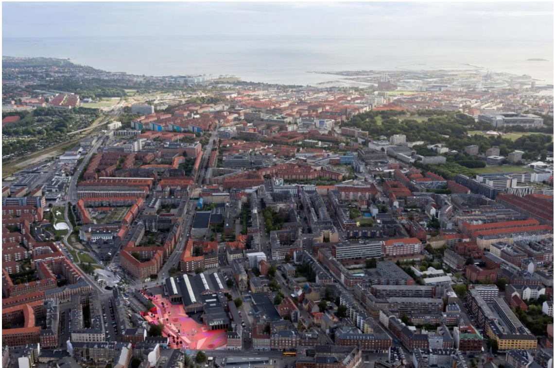
Kuva 1. Superkilen ja ympäröivä kaupunki yläilmoista (mukaiillen lähteestä Baan 12).