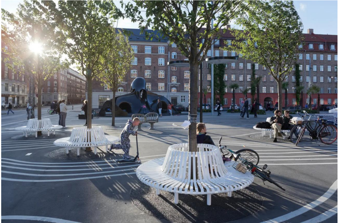
Kuva 8. Renkaan malliset penkit Black Marketissa (mukaillen lähteestä Baan 2012).