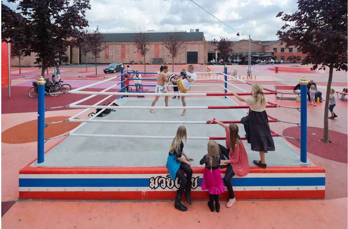
Kuva 6. Thai nyrkkeilykehä Red Square-alueella (mukaillen lähteestä Baan 2012).

myös kehän ympärillä syntyvät sosiaaliset tilanteet havaittiin positiivisiksi kulttuurien välisiksi tapahtumiksi, jotka toistuessaan pitivät yllä jaettua ymmärrystä toisia kohtaan sekä mahdollistivat uusien ihmissuhteiden syntymisen. (Daly 2019, 75)