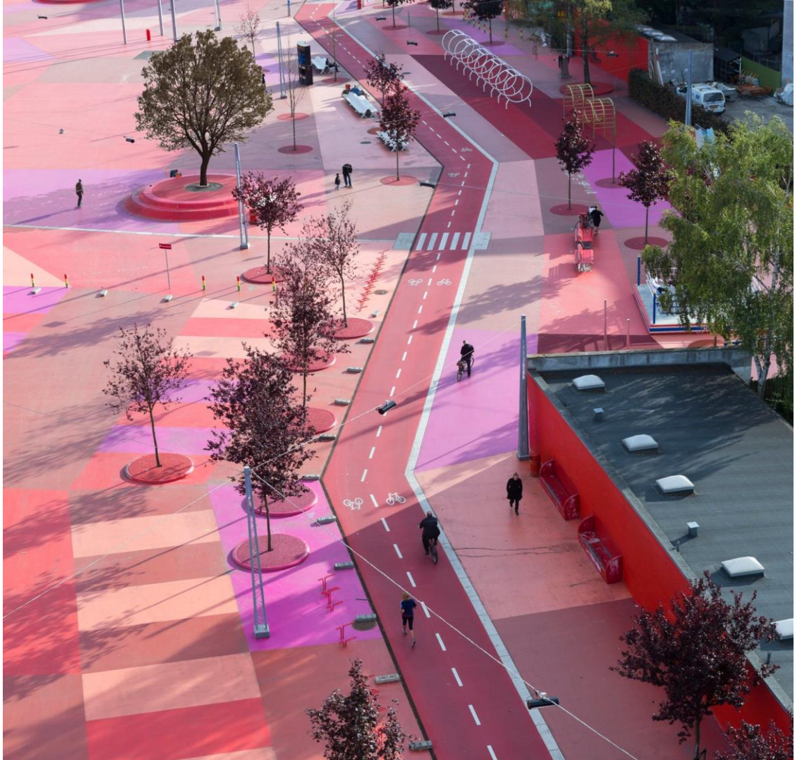
Kuva 3. Red Square ja yksisuuntaiset pyöräkaistat (mukaillen lähteestä Baan 2012).