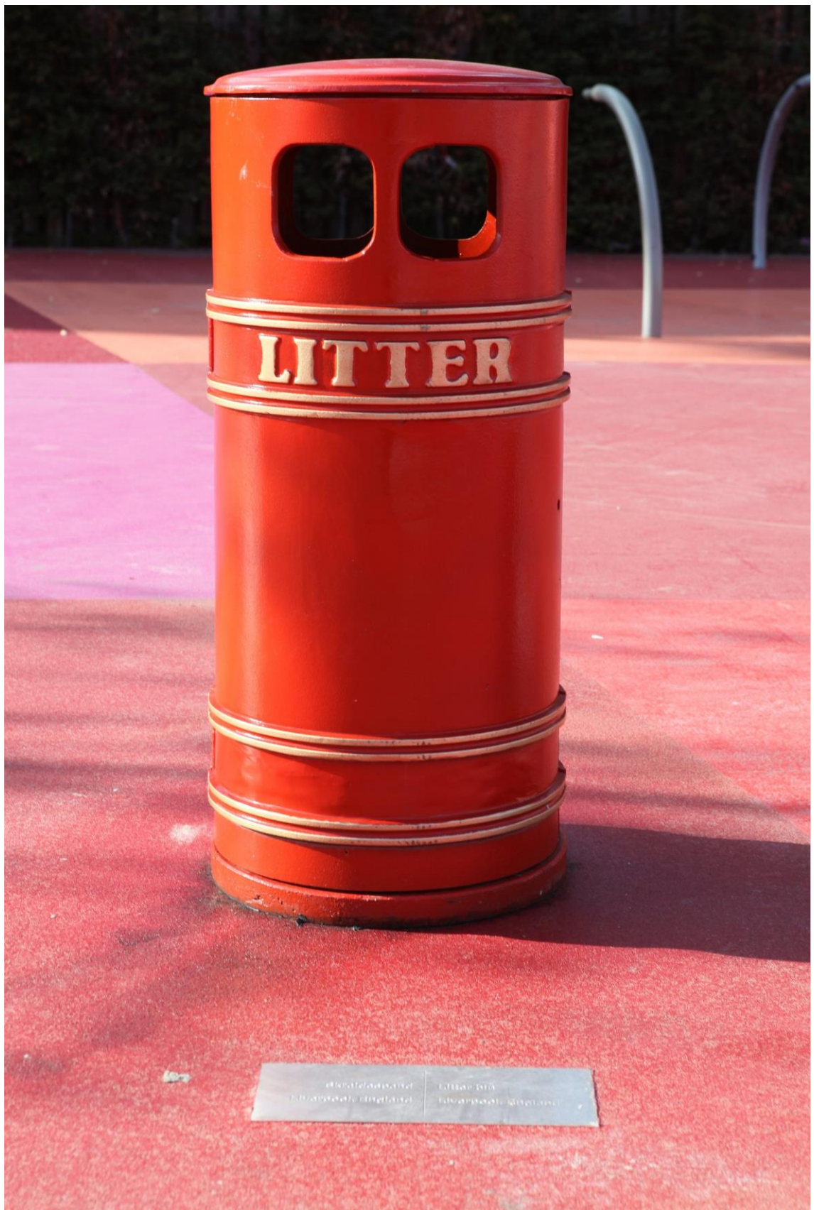
Kuva 9. Roska-astia Liverpoolista Englannista (Eskerod 2012).