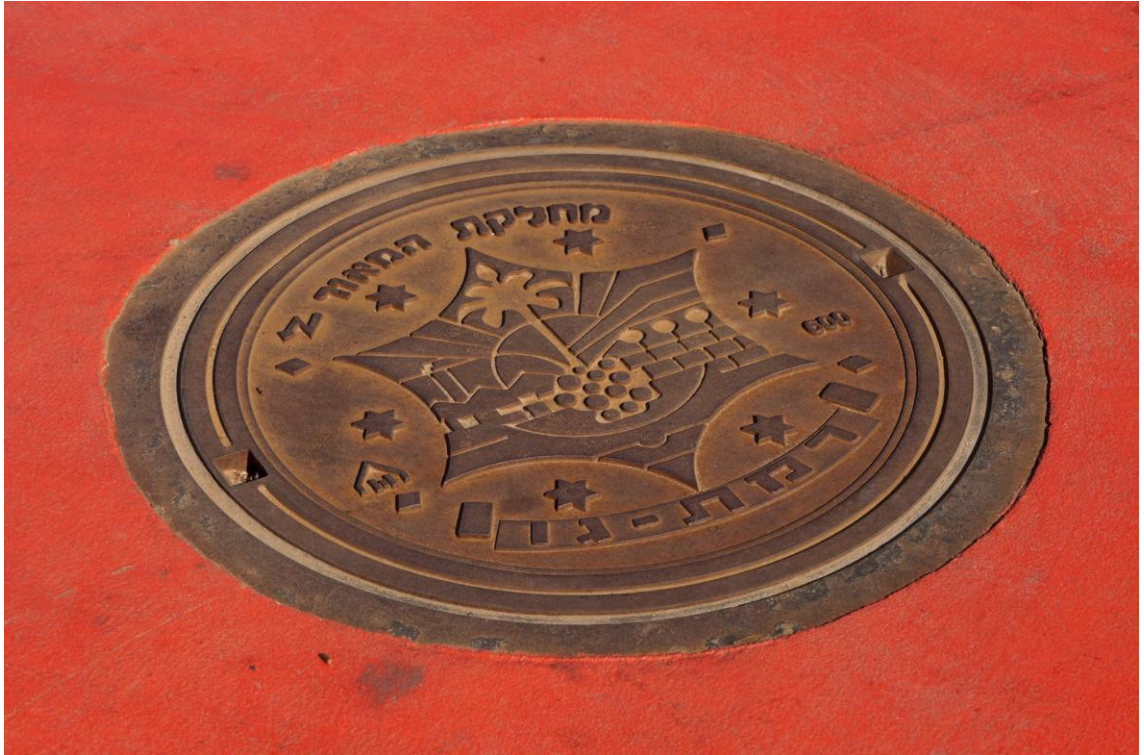
Kuva 10. Viemärinkansi Israelin Tel Avivista (Eskerod 2012).