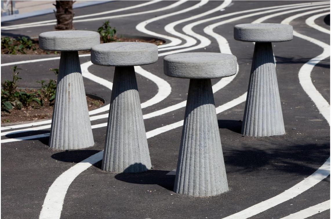
Kuva 7. Brasilialaiset baarituolit Black Market-alueella (Eskerod 2012).

Puiston suunnitteluprosessiin osallistettiin myös naapuruston asukkaita. Eri kulttuureista otettujen istuimien lisäksi puistoon suunniteltiin, paikallisten kanssa toteutettujen keskusteluiden perusteella, erilaisia istuimia (kuva 8). Lähtökohtana oli ihmisten toive saada istuimia, joissa ollessaan he pystyvät katsomaan toisiaan silmiin, istumaan vastakkain ja kommunikoimaan keskenään. Tämän perusteella puistoon suunniteltiin muunmuuassa pyöreitä renkaan mallisia penkkejä. (Daly 2019, 76) Yhteensä suunniteltuja penkkejä on viisi ja ne sijoitettiin puiston "olohuoneeseen" Black Market -torialueen keskiöön. Pyöreät penkit, eivät kuitenkaan vastanneet täysin asukkaiden toiveisiin. Naapuruston jäsenet kertoivat myöhemmin, Dalyn haastatteluissa, toivoneensa koveran muotoisia istuimia, joilla istuessaan vierekkäin pystyisi paremmin katsomaan toisia silmiin ja siten luonnollisesti kommunikoimaan ja keskustelemaan. Renkaan muotoisilla penkeillä tämä todettiin vaikeaksi. (Daly 2019, 76) Erityisesti se, että penkkien keskelle on istutettu kirsikkapuita, vaikeuttaa kommunikaatiota, sillä penkillä pystyy istumaan vain katse ulospäin ringistä. Tavoitteestaan huolimatta pyöreät penkit, epäonnistuivat luomaan sosiaalisia tilanteita ja olivat siten, yhtä "huonoja" kuin tavalliset suorakaiteen muotoiset penkit (Daly 2019, 76).