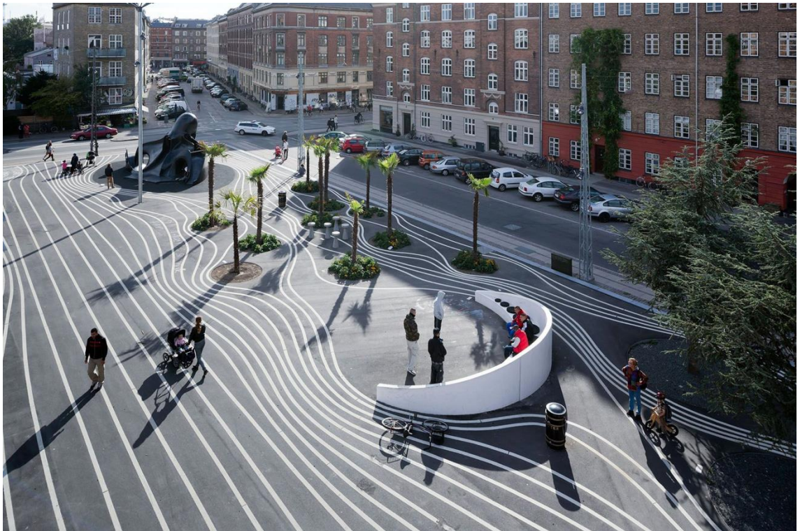
Kuva 13. Kaareva penkki Black Marketissa (mukaillen lähteestä Baan 2012).

kaupunkitilassa. Toisten ihmisten näkeminen ja kuuleminen tarjoaa ihmiselle kaikissa olosuhteissa tietoa, ymmärrystä ja inspiraatiota. Se voi myös olla alku jollekin muulle, syvemmät kontaktit saavat nekin alkunsa näkemisestä ja kuulemisesta. - - Mahdollistavia tekijöitä ovat esteettömät näkymät, lyhyet etäisyydet, - - ja katseen suuntaus koettavaa asiaa kohti. ” (Gehl 2018, 236) Mielenkiintoiset näkymät ovat yhteydessä viihtyisyyteen ja siten ihmisten olemiseen kaupunkitilassa, mikä puolestaan on edellytys sosiaalisille kontakteille. Dalyn havaintojen perusteella, aktiivisiin kohtiin sijoitetut istuimet ovat suosituimpia ja eniten käytössä. Istuimien sijoittaminen strategisesti tällaisiin kohtiin lisää sosiaalisia tapahtumia, kun ympäristö mahdollistaa osallistumisen yhteiseen toimintaan ja luo pohjan kommunikaatiolle. Superkilenistä löytyy paljon istumapaikkoja, mutta istuimet on ripoteltu ympäri puistoa hyvin sattumanvaraisesti, eivätkä ne siten ole yhtä houkuttelevia käyttäjälle, kuin jos ne olisi sijoitettu kohdennetummin aktiivisiin tai näkymältään mielenkiintoisempiin osiin puistoa.