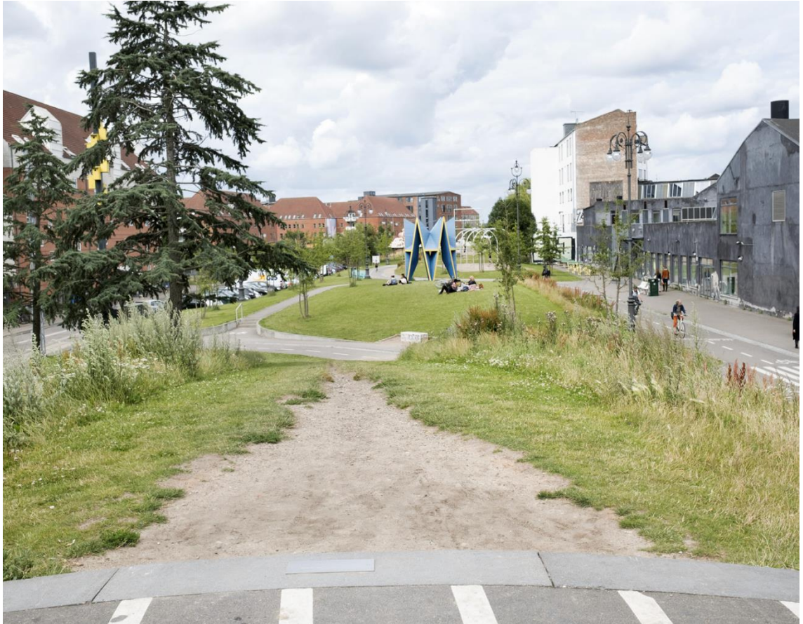
Kuva 12. Näkymä Green Parkista (mukaiillen lähteestä Autzen 2018, 9).

Selkeä toiminnallisuus Superkilenissä kannustaa aktiivisuuteen, mikä puolestaan auttaa muodostamaan sosiaalisia kontakteja. (Daly 2019) Lisäksi selkeä toiminnallisuus helpottaa oleskelua ulkotilassa, sillä aktiivisuutta pidetään yleisesti positiivisempänä kuin päämäärätöntä oleskelua. Päämäärätön oleskelu kaupunkitilassa nähdään usein ongelmallisena, sillä se yhdistetään epäilyksiin rikollisuudesta. Lisäämällä toimintoja julkisissa tiloissa, sekä suunnittelemalla runsaasti istumapaikkoja voidaan lisätä jaettua turvallisuuden tunnetta, aktiivisemmän toiminnan seurauksena. Näin ollen ihmisryhmät, jotka muuten saattaisivat joutua etnisen profiloinnin uhreiksi, voivat helpommin nauttia yhteisestä kaupunkitilasta. (Risbeth et al. 2016, 48–49)