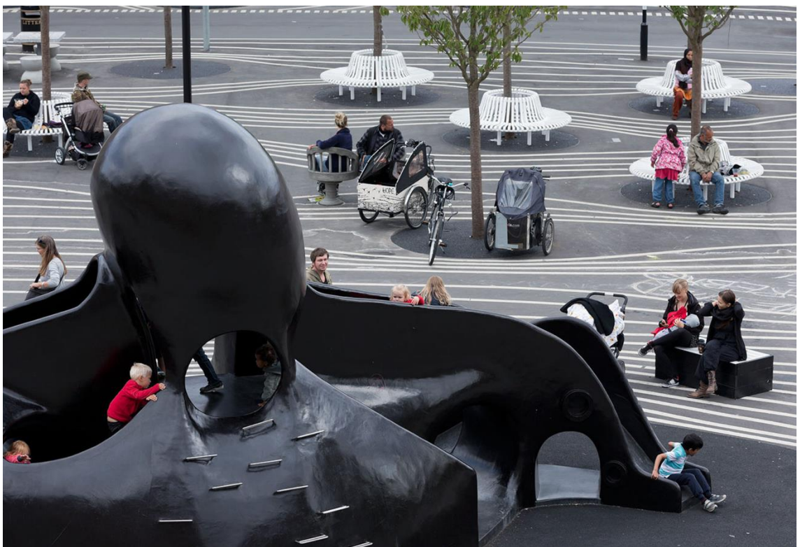
Kuva 5. Mustekalan muotoinen liukumäki Black Marketissa (mukaiillen lähteestä Baan 2012)

Osana ”leikitapahtumaa” hyödynnettiin myös muita lähiympäristön objekteja kuten marokkolaista suihkulähdettä ja belgialaisia penkkejä, joilla vanhemmat istuivat yhdessä lapsia valvoessa. Näiden välineiden ottaminen mukaan toimintaan, mahdollisti vuorovaikutuksen myös leikistä ulkopuolisten kanssa: ihmisten, jotka sattuiivat viettämään aikaa penkeillä tai suihkulähteen luona. (Daly 2019, 73–75) Lasten leikki- ja liikuntapaikat ovat tiettyyn tarkoitukseen suunniteltuja tiloja, joissa ihmiset voivat kohdata toisia yhdessä toimiessaan. Näissä paikoissa spontaanisi syntyvät vuorovaikutukset voivat auttaa solmimaan sosiaalisia siteitä alueen asukkaiden kesken ja auttaa muodostamaan myös syvällisempiä ihmissuhteita tai ystävyksiä. (Risbeth et al. 2016, 45)