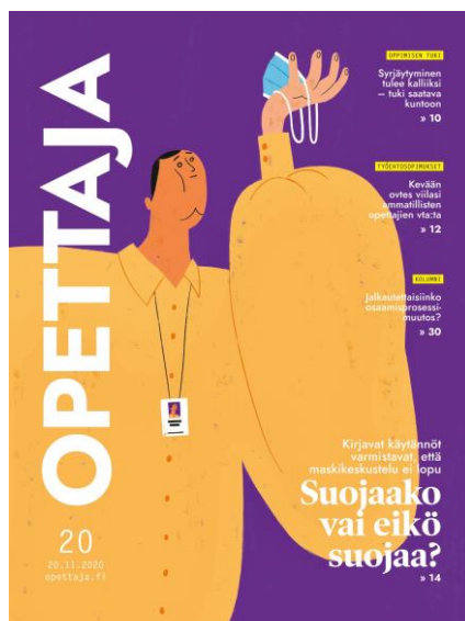
Kuva 1. Opettaja-lehden kansi 20.11.2020

Opettaja-lehti valittiinkin analysoitavaksi juuri sen vapaamman otteen takia, sillä tarkoituksena oli selvittää, millaista keskustelua turvallisuudesta käytiin ei-tieteellisen julkaisun sivuilla. Opettaja-lehden sisältö koostuu lehden omien toimittajien laatimista artikkeleista, uutisista ja muusta vastaavasta sisällöstä. Sen sivuilta löytyy myös ulkopuolisten kolumnistien tekstejä ja lukijoiden mielipidekirjoituksia.