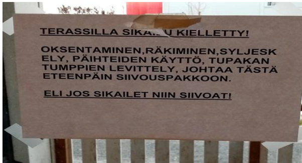
Kuva 2: Kulkuovi terassille

Toimistossa on asiakaskäyttöön oma puhelin, jolla asiakkaat voivat hoitaa virastoasioita. Asiakkaiden käytössä on myös toimiston viereisessä huoneessa tietokone, jota voi käyttää esimerkiksi asunnon hakuun ja viranomaisasiointiin. Asumisyksikössä on myös sosiaalityöntekijä. Lääkehoito toteutuu henkilökunnan jakamana, asiakkaat tuovat tilapäiseen asumiseen tullessaan omat lääkkeet mukanaan. Lääkäri käy asumisyksikössä pääsääntöisesti kerran viikossa.