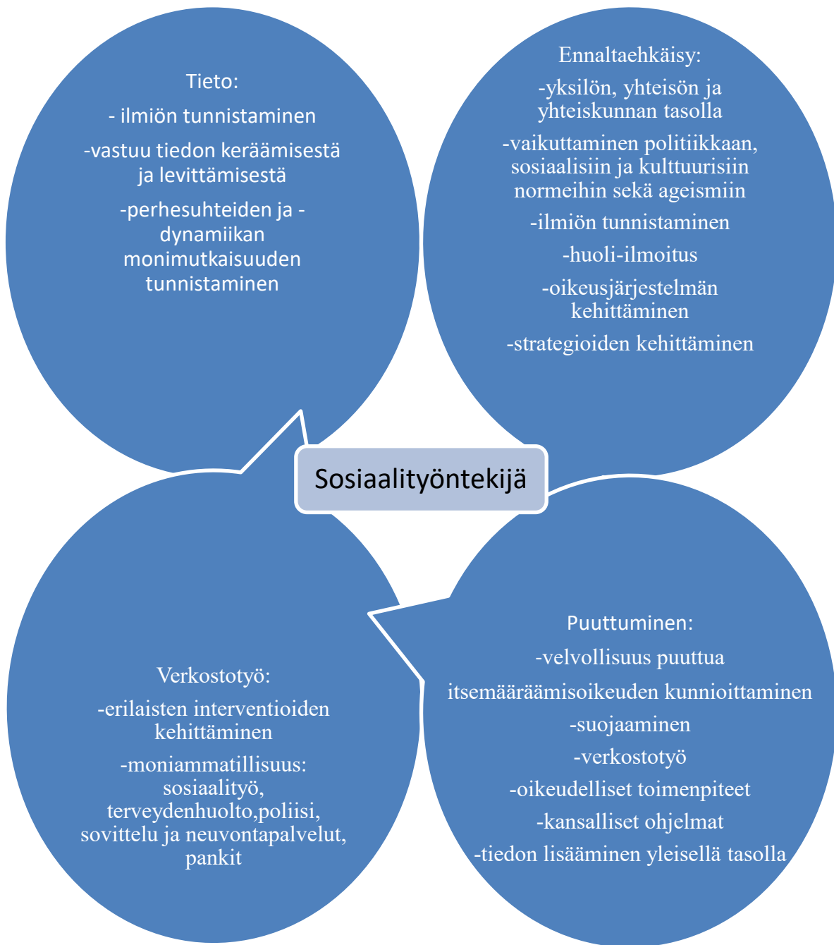
Kuvio 3. Sosiaalityöntekijän keinoja taloudellisesti kaltoinkohdellun ikäihmisen tukemisessa.