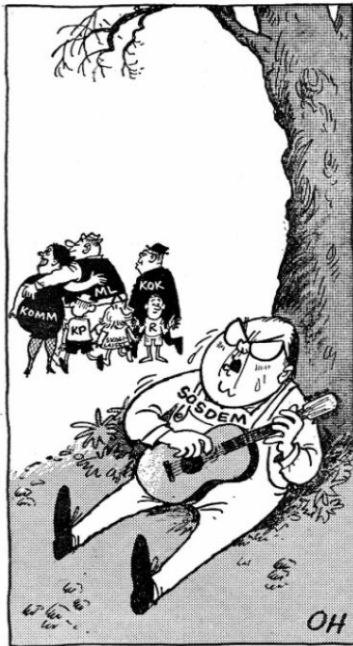
Kuva 3 62