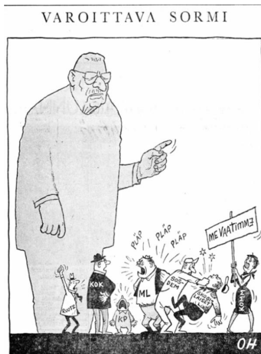
Kuva 2 56