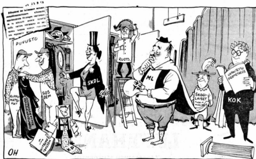
Kuva 1 52

Tarkasteltaessa esimerkkinä yllä olevaa "Esiriput avautuvat" pilakuvaa, voidaan todeta paitsi hahmojen moninaisuus ja erottelemieni variaabeleiden näkyminen, myös selkeä poliittinen maailmankatsomus Kokoomushahmon ollessa harmoninen ja puolueen kannattajia varsin stereotyyppisesti, mutta huumorittomasti, kuvaava esimerkkihahmo. Kuva toimii myös esimerkkinä siitä, miten ajankohtaiset tapahtumat toimivat näyttämönä myös puoluepolitiikan kuvaukselle, huumorin syntyessä kahden vastakohtaisen ilmiön yhdistämisestä, mikä on pilapiirrosvitsin kulmakivi 53 . Tämän humoristisesti esitetyn kannanoton pohjalta Uusi Suomi -lehden lukija katsoo koko muuta puoluekenttää ja näkee omien lähtökohtiensa kautta niiden heikkoudet ja hölmöydet sekä tuntee yhtenäisyyttä tavassa suhtautua tähän kaikkeen. Näin asettaen itsensä ylemmäksi ja ansaitusti nauraen vastapuolelle, joiden toiminta kuvissa ilmentää puolueisiin ja niiden kannattajiin liittyviä yleisiä oletuksia ja merkityssuhteita. Poliittiselle pilakuvulle nauramalla yksilö osoittaa paitsi omaa huvittuneisuuttaan, myös kuuluvansa ympärillä nauravien joukkoon, samanmielisiin kansalaisiin.