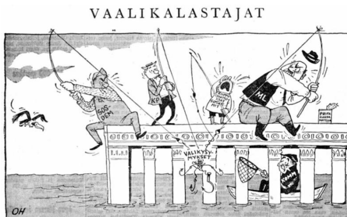
Kuva 6 75

Suomen sisäpolitiikkaan liittyvät tapahtumat, kuten sosialidemokraattien hajaantuminen ja Neuvostoliiton vaikutus ja läsnäolo eivät aina näy kuvissa suoraan, mutta niiden merkitys oikeistolaisesta näkökulmasta on merkityksellistä tiedostaa. Kommunismiin suhtautuminen välittyi paitsi Kuusisen karrikoidun hahmon olemuksessa, kuin myös niissä harvoissa kuvissa, joissa viitataan puoluekentän suhtautumiseen yleisesti itäsuhteisiin.