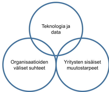
Kuva 2. Kunnossapidon datapohjaiseen palveluliiketoimintaan kohdentuvia vaatimuksia.