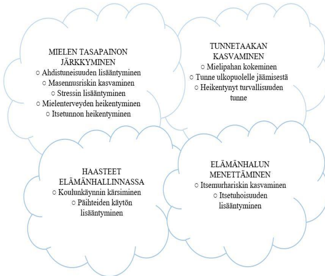
Kuvio 3. Kiusaamisen seuraukset sateenkaarinuorten hyvinvointiin.

Mielen tasapainon järkkäminen, tunnetaakan kasvaminen, haasteet elämännhallinnassa sekä elämännhalun menettäminen ovat seurauksia, joita kiusaaminen aiheuttaa sateenkaarinuorten hyvinvointiin. Tulokset on esitelty kuviossa 3.