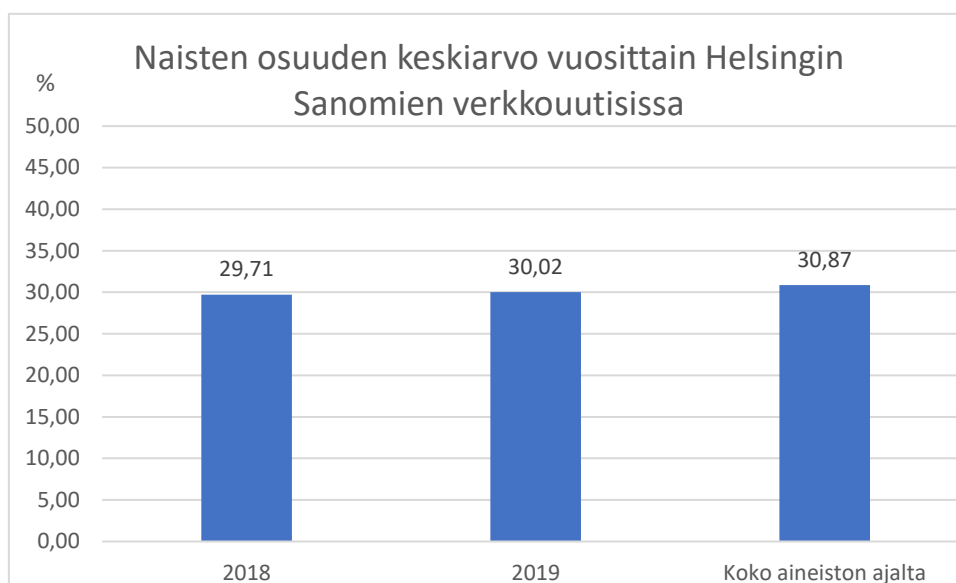
Kaavio 1.1 Naisten osuuden keskiarvo vuosittain Helsingin Sanomien verkkouutisissa.

Sen lisäksi, että määrä on kasvanut hieman, näyttää naisten esiintyvyys hajautuneen ääripäihin erityisesti vuonna 2020. Aineiston kolme korkeinta sekä kolme matalinta lukua esiintyivät kaikki vuonna 2020. Tämän pystyy havainnoimaan myös kaaviosta 1.2 jossa luvut on esitetty aikajanalla. Kaaviosta voidaan havaita, että vuoden 2020 aikana kaaviossa esiintyy aiempia tarkasteluvuosia korkeampia ja matalampia huippukohtia. Tämä tarkoittaa sitä, että vuoden 2020 aikana on esiintynyt päiviä, jolloin naisten määrä on ollut korkeampi tai matalampi kuin aiempina vuosina.