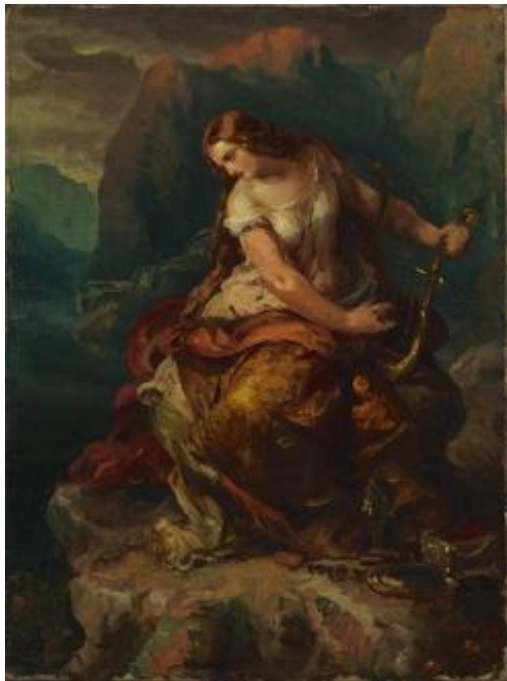
(Abb.2: Carl Ferdinand Sohn, Loreley )

Die Loreley als Frau wird mit goldenen Haaren dargestellt, die sie diesmal nicht kämmt, sondern eine Kaiserkrone trägt. Der goldene Kamm , von dem noch in Heines Gedicht die Rede war, weicht nun einer goldenen Leier . Tatsächlich wurde Loreley in den bildenden Künsten oft mit einer Leier oder einer Laute dargestellt, so beispielsweise mit einer Laute 1835 von Carl Joseph Begas (S.19, Abb.1), oder 1852/53 mit einer Leier von Carl Ferdinand Sohn (Abb.2).