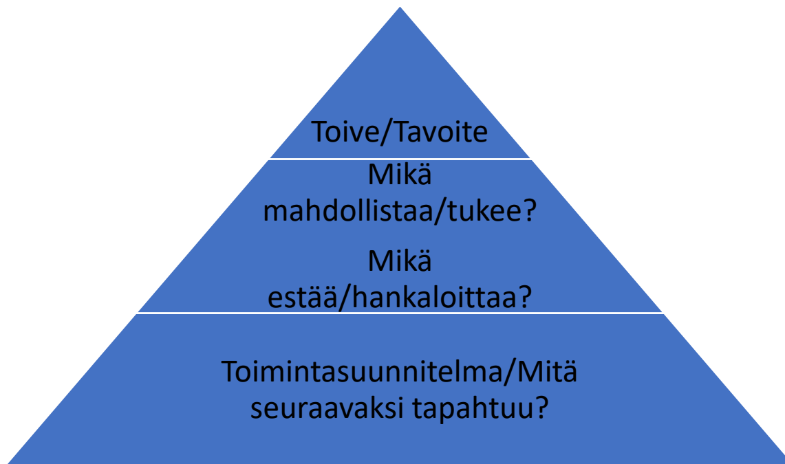
Kuvio 2. Segmenttipyramidi