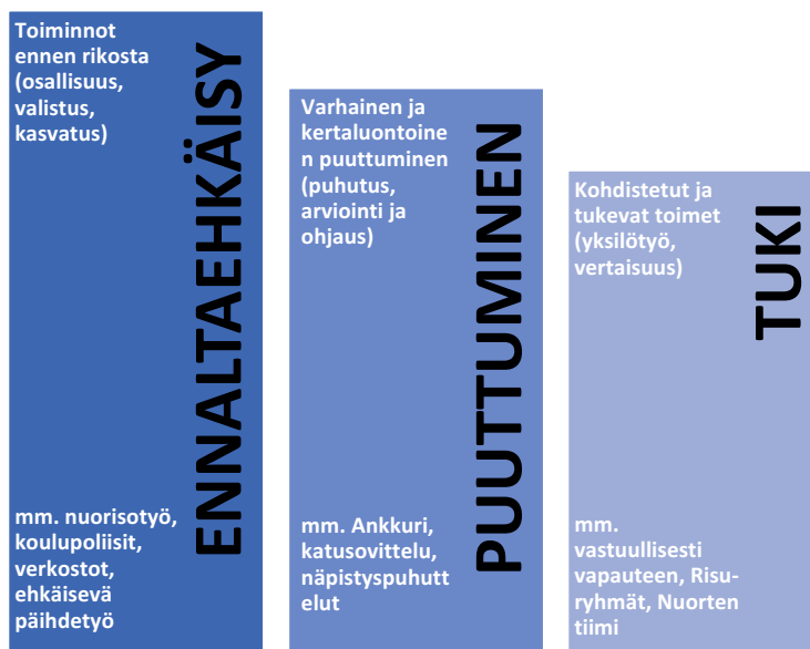
Kuvio 1. Jaottelu ehkäisevään, puuttuvaan ja tukevaan toimintaan.