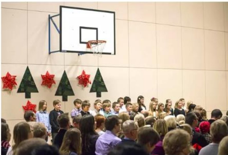
Koulujen joulujuhliin liittyvässä kantelussa ei ollut kyse vapaaehtoisesta kirkkokäynnistä, vaan koulun yhteisestä päättäjaisjuhlasta. Kuva koulun liikuntasalissa pidetystä koulun joulujuhlasta Lohjalla vuonna 2013.

Opetusministeri Li Anderssonin mukaan kirkkoon kuuluvat ja muut halukkaat voivat jatkossakin mennä joulukirkkoon. "Tuntuu, että tässä on aika paljon väärinkäsityksiä nyt liikkeellä", Andersson sanoo.