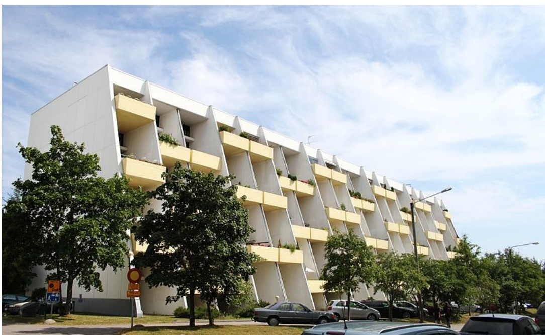
Kuva 2. Touko Nerosen suunnittelema terassitalo

Vaikka Vuosaarta rakennettiin pitkälti ei-ammattilaisten voimin (MyHelsinki), rakentui 1960-luvulla myös arkkitehtonisesti merkittäviä kohteita, kuten Touko Nerosen suunnittelemat terassitalot (Kuva 2, Säästöniemi.fi), sekä Viljo Revellin ja Heikki Castrenin tornitalo Säästömast. Kehittyvästä alueesta kiinnostui myös Paulig Oy, joka siirsi toimintansa Vuosaareen 1960-luvun puolivälissä (Vanhan Vuosaaren kehittämisohjelma 1996, 8). Vuosien varrella Pauligista muodostui tärkeä osa Vuosaaren alueen identiteettiä, ja sen vaikutus alueen kehitykseen oli merkittävä.