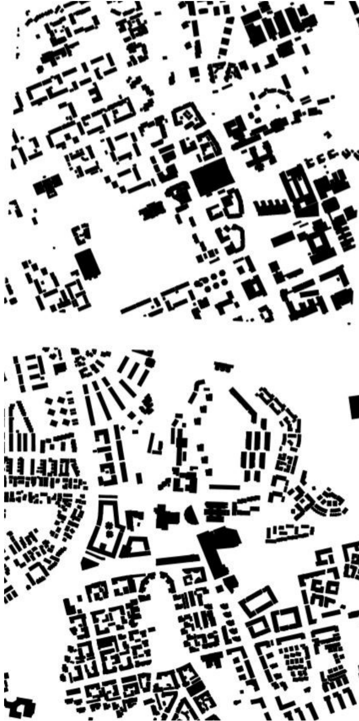
Kuva 4: Rakeisuuskaavio-otteet Hervannasta ja Vuosaaresta vuodelta 2020. Hervanta yllä, Vuosaari alla

lahtea kutsutaan jopa Helsingin Rivieraksi. (Vuosaari.fi, Uutta Helsinkiä.fi) Hervannasakin asukkaat pitävät ulkoilumaastoja tärkeänä, mutta kenties metsälähiön negatiivisen maineen vaikutuksesta metsästä ei ole muodostunut Hervannan brändiä. Tampereen kaupungin tavoitteet 2020-luvulla tähtäävät kohti metropolia ja suurkaupungin tunnelmaa (Tampereen seutu 2040), ja tästäkään syystä ajatus ”metsäisestä Hervannasta” ei välttämättä sovi nykyiseen Hervannan mainontaan.