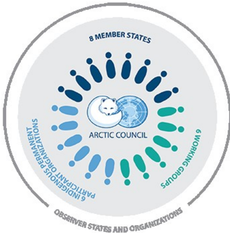
Kuva 1: Arktisen neuvoston jäsenmaita ovat Suomi, Ruotsi, Norja, Islanti, Tanska, Yhdysvallat, Venäjä ja Kanada. Kuusi arktista alkuperäiskansajärjestöä ovat neuvoston pysyviä edustajia. Pääosa neuvoston työstä tehdään kuudessa työryhmässä.

Arktista neuvostoa johtaa vuorollaan kukin jäsenmaa kahden vuoden ajan, ja neuvoston päättävä elin on kahden vuoden välein järjestettävä ulkoministerikokous. Kokous järjestetään kunkin puheenjohtajuuskauden lopussa puheenjohtajamaan johdolla. Arktisen neuvoston päätökset tehdään neuvoston jäsenmaiden konsensusperiaatteella alkuperäiskansajärjestöjä konsultoiden. Ulkoministerikokousten välissä Arktisen neuvoston toimintaa ohjaa virkamieskomitea ( Senior Arctic Officials ). Arktisen neuvoston työ tehdään suurimmalta osin kuudessa työryhmässä. Työryhmät tekevät tieteellistä tutkimusta, toteuttavat ympäristöhankkeita ja antavat suosituksia. (Ulkoministeriö, 2019.)