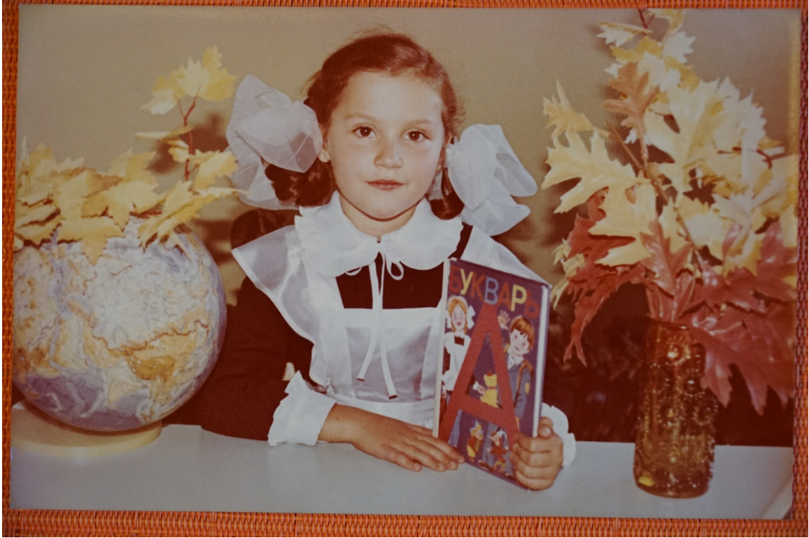
Kuva 1. Tyttö yllään koulupukuun kuuluva valkoinen esiliina ja valkoiset rusetit