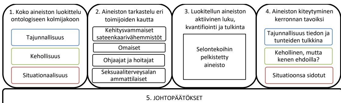
Kuvio 2 Analyysiprosessin päävaiheet.