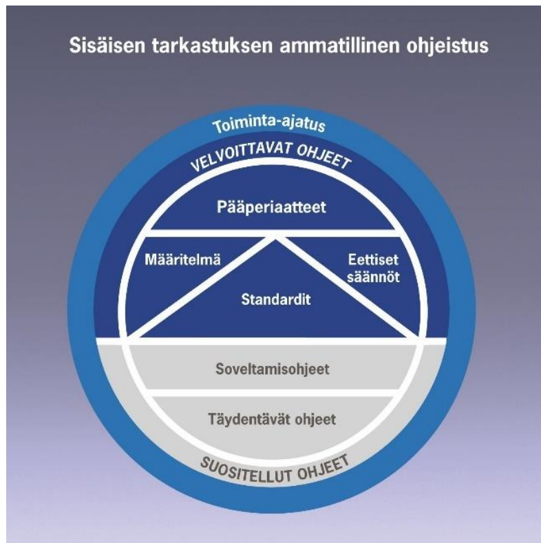
Kuvio 2. IIA:n sisäisen tarkastuksen ammatillisten käytäntöjen ajatusmalli (International Professional Practices Framework). 108

Ympyrän uloimman kehyksen muodostaa sisäisen tarkastuksen toiminta-ajatus: ”Sisäisen tarkastuksen toiminta-ajatuksena on lisätä ja turvata organisaation arvoa tarjoamalla riskiperusteista ja objektiivista varmistusta, neuvoja ja näkemyksiä”. 109 Toiminta-ajatus kertoo, mitä sisäinen tarkastus pyrkii saavuttamaan organisaatiossa. Siinä korostuu lisäarvon tuottaminen, johon sisäisen tarkastuksen tulee pyrkiä, oli kyseessä sitten konsultointi tai varmennus- ja arviointipalvelu. Toiminta-ajatus muodostaa kehyksen, jonka alle kaikki muu ohjeistus sisältyy.