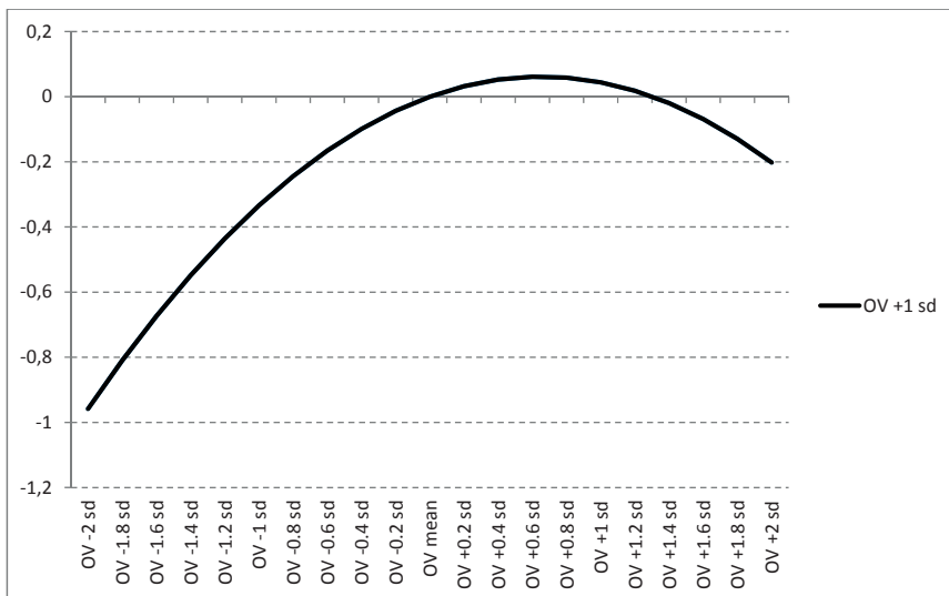
Kuvio 1. Lisäntyneiden oppimisvaatimusten interaktio (OV*OV) työn merkityksellisyyteen teollisuus- ja palvelualalla.

Kontrollimuuttujat: sukupuoli 1 = nainen, 2 mies; ikä = jatkuva muuttuja (nuoresta vanhempaan); koulutus = ammatillisesta perustutkinnosta tohtorin tutkintoon (ks. Taulukko 1)