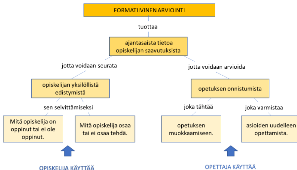
KUVIO 1. Formatiivinen arviointi ja assessment of learning (Graf 2016, suom. Atjonen ym. 2019, 35)

Black ja William (1998, 2) pitävät formatiivista arviointia (AfL) vaikuttavan opetuksen sydämenä. Opettajien on tunnistettava niin oppilaiden edistyminen kuin haasteetkin oppimisessa voidakseen tarjota juuri oikeanlaista tukea. Black ja William (2006, 15) ja Black ym. (2004, 10) korostavat oppimisprosessissa oppilaan omaa toimijuutta, jolloin itse- ja vertaisarviointi nousevat myös merkittävään rooliin arvioinnin toteuttamisessa.