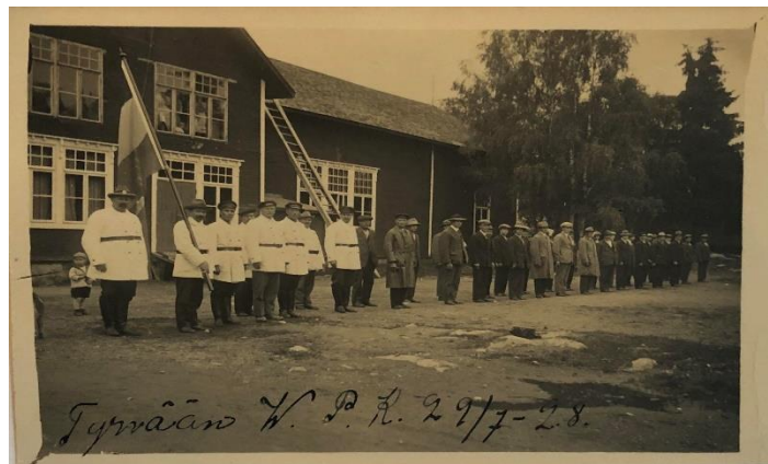
Kuva 3: Tyrvään vapaapalokunta valmistautumassa paraatiin 22.7.1928. 45