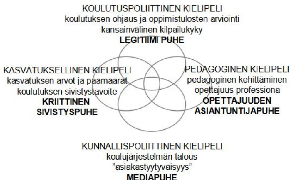
KUVIO 2. Koulun tuloksellisuus kielipelinä (Oravakangas 2005, 104).

Kielenkäytössä koulutusasiat ovat eriytyneet kasvatuksen ja sivistyksen käsitteistä. Kouluelämään kuuluneen kasvatuksen kielen on korvannut koulutuksen kieli, jonka sanastossa ei tunnu olevan luontevaa sijaa kysymykselle kasvatuksen päämäärästä tai ihmisen henkisestä kasvusta. (Oravakangas 2005, 18.) Tuloksellisuuden arvioinnista on tullut legitiimi velvoite koulutuksen alalla ja tässä prosessissa opettajat ovat tuloksentekijän roolissa (emt., 20). Oravakangas lähestyi aihetta kielipelin käsitteen avulla. Kuvio 2 osoittaa, millaisissa erilaisissa kehyksissä tuloksellisuusdiskursseja käydään.