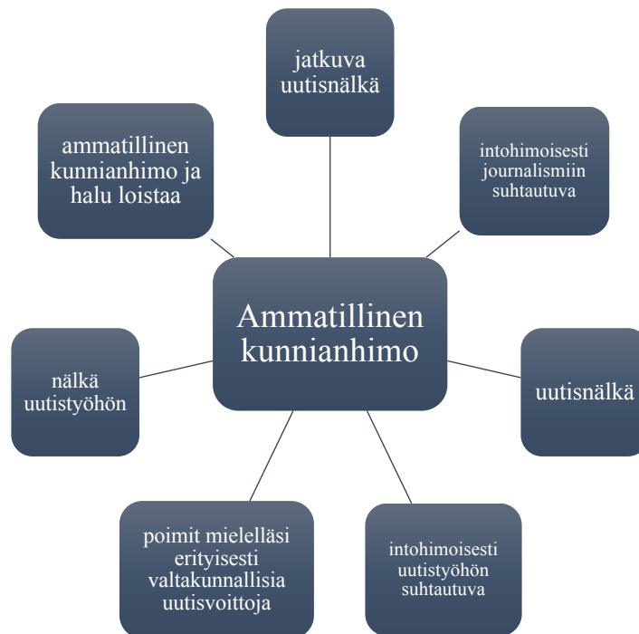
Kuvio 1: Esimerkki määreiden luokittelusta.

esimerkiksi ”innostunut” ja ”innokas asenne” menivät saman innostuneisuus-alaluokan alle. Luokittelua ohjasi siis aineisto.