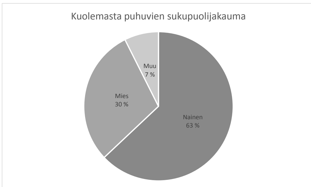
Kuvio 2. Kuolemasta puhuvien sukupuolijakauma. Naiset puhuvat naistenlehdissä kuolemasta miehiä useammin.

Jutut olivat pääasiassa henkilöhaastatteluja, joissa omaiset puhuivat läheistensä poismenosta. Naistenlehdelle ehkä odotettuunkin tapaan suurin osa haastatelluista oli naisia. Naiset puhuvat kuolemasta 63 prosentissa jutuista. Miehet puhuvat aiheesta lehdissä huomattavasti vähemmän, vain 30 prosentissa jutuista. Muihin puhujiin on luokiteltu esimerkiksi julkkiksen elämästä kertoneet artikkelit, joihin varsinaisesti ei ole siteerattu ketään haastateltavaa.