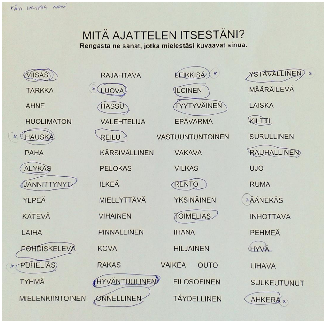
Kuva 1. Kaisan adjektiivivalinnat

Kertoessaan valinnoistaan ja niiden merkitysisällöistä, Kaisa kuvasi myös tunteitaan. Esimerkiksi kun Kaisa valitsi itseään kuvaamaan sanan ”jännittynyt” hän kertoi valinnastaan seuraavasti: