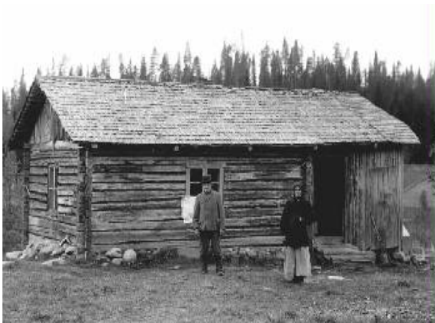
Kuva 2. Torppa 1920-luvulta. 33