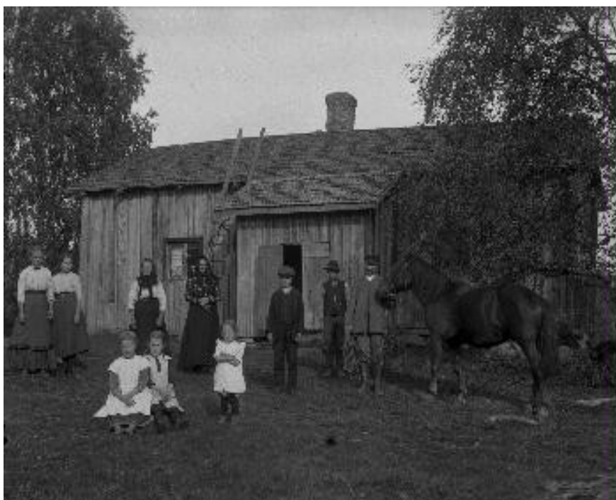
Kuva 1. Torppa Ruovedeltä 1910- tai 1920-luvulta. 32

vaikuttaa melko tyypilliseltä torpalta, kuvassa 2 on esimerkki köyhästä torpasta. Kuvissa 3 ja 4 on kyseessä varakkaat torpat, joissa elintaso oli luultavasti hyvin samaa luokkaa kuin pienillä itsenäisillä viljelmillä.