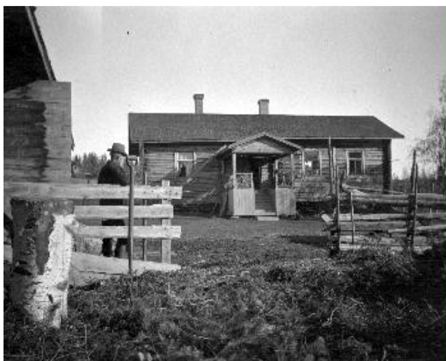
Kuva 3. Kuuslahden torppa Tampereelta vuonna 1910. 34