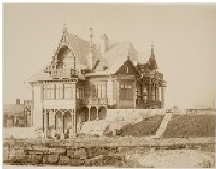
Kuva 5. Borgströmin huvila Hankoniemessä 1890-luvulta. 100

”huvilatyyppisinä”. Kuvassa 6 on talonpoikaistalo Orivedeltä vuodelta 1902. Rakennus on talonpoikaiseen tapaan suorakaiteen muotoinen ja rakennusmestareiden hyväksymällä hillityllä tavalla koristeltu: ikkunanpielissä on koristelaudat ja kuistissa hieman koristeleikkauksia, mutta koristelu ei ole ollut rakentajalle itseisarvo, kuten vaikuttaa olleen Borgströmin huvilan tapauksessa.