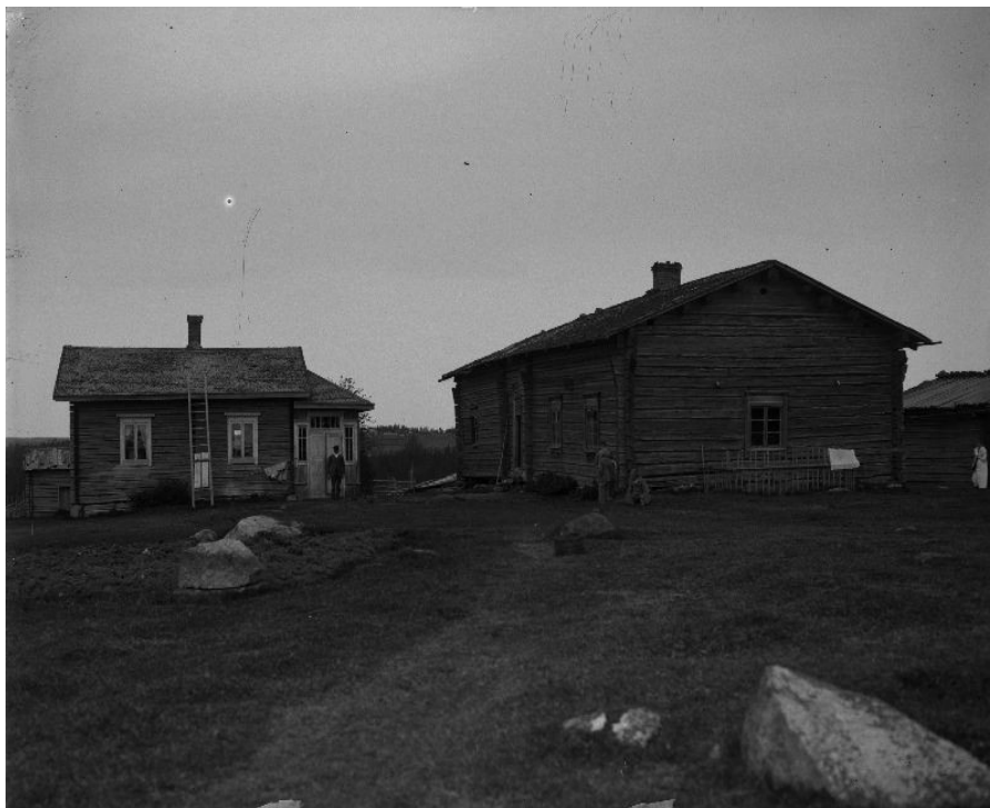
Kuva 4. Kalliojärven torppa Kurusta vuonna 1901. 35

Jokaisessa kuvassa rakennuksissa on pärekatto, joka oli tyypillinen katemateriaali 1850-luvulta 1950-luvulle. Arvioiden mukaan 1930-luvulla, jolloin pärekaton yleisyys maaseudulla saavutti huippunsa, peräti 83 % asuinrakennuksista oli katettu päreellä. 36 Pärekaton yleistymiseen vaikuttivat pärehöylän kehittäminen, jolla päreitä voitiin nopeasti valmistaa suuria määriä sekä katemateriaalin edullisuus – puuta kului yhden päreen valmistukseen melko vähän. Pärekaton käyttöikä oli noin 15-20 vuotta, mutta se oli helposti korjattavissa. Peräkaton haittapuolena oli tulenarkuus. 37 Jokainen rakennus näyttää olevan perustettu lähelle maata ilman kunnollista kivijalkaa, mikä tarkoittaa, että rakennusten alimmat hirsikerrat ja lattiat olivat jatkuvasti alttiina kosteudelle ja homevaurioille. Jokaisessa kuvassa pihapiiri vaikuttaa avoimelta. 1900-luvun alkupuolella puutarhaviljely ei ollut vielä yleistynyt maaseudun työväestön keskuudessa, vaikka erilaiset maanviljelysseurat parhaansa yrittivät valistustyössä. Yleensä pihapiireissä oli pihapuu, tyypillisesti koivu, joita kuvassa 1 on kaksin kappalein. Pihapiirien avoimuudelle oli myös käytännönläheinen syy: avoimessa pihassa eivät itikat viihtyneet.