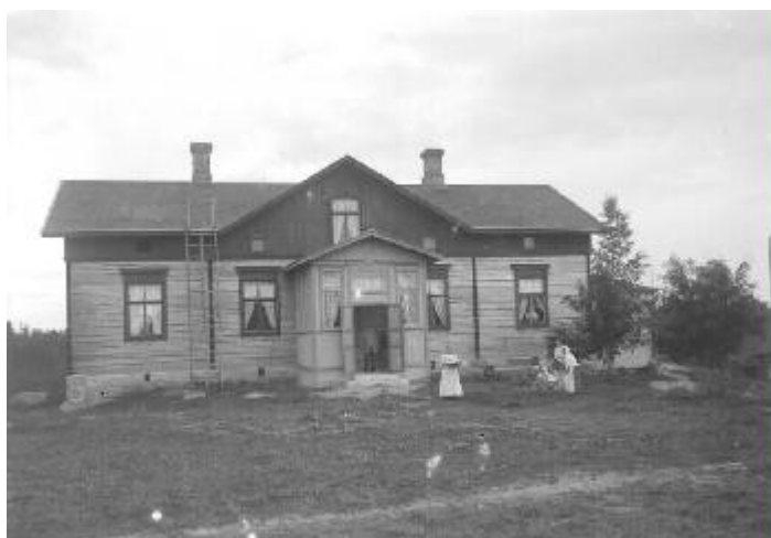
Kuva 6. Talonpoikaistalo Orivedeltä vuodelta 1902. 101