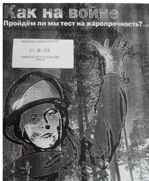
Рисунок 3 (АиФ Обложка).

Можно сказать, что фотографии являются либо такими же, как пропагандистские фото советского времени (пропаганда) либо каким-то образом привлекающими внимание аудитории. Наверное, самым ярким и широко распространённым примером пропаганды в годы СССР служили советские плакаты, которые были призваны в доступной форме доводить до массового сознания коммунистические идеи — в некоторых случаях в наших материалах используются именно картины похожие на постеры советского времени. Картина предельно понятна, содержит энергичный, емкий, яркий текст и характерное изображение. Идея фотографий, представлено нами выше (см. 3) – именно такая.