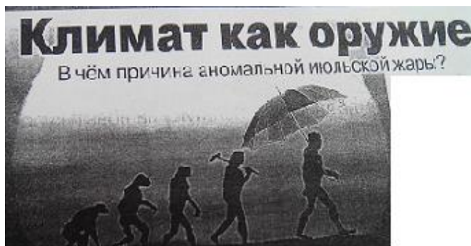
Рисунок 2 (АиФ 12).