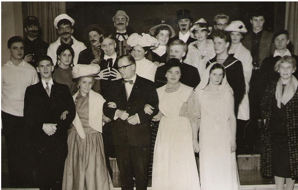
Seminaarin näytelmäkerhon kuva Thornton Wilderin ”meidän kaupunkimme” näytelmästä, vuosi 1961