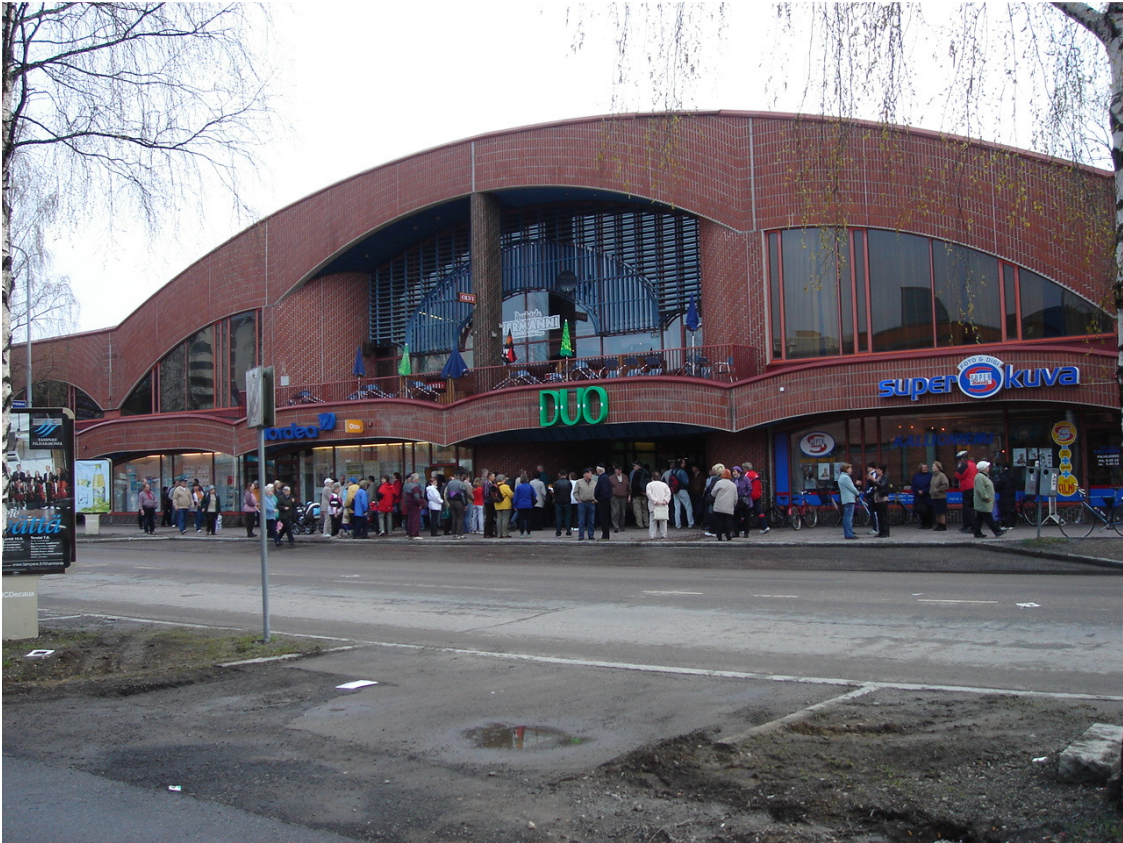
Kuva 1. Kuvassa väkijoukko odottaa pääsyä uudistuneeseen kauppakeskus Duon muutamaa minuuttia ennen avajaisten alkua. Kuvan väkijoukko on kokoontunut vanhan, Insinöörinkadun puoleisen, pääoven puolelle.

määrätietoisesti kauppakeskuksen pääoven paikan sijainnin olevan Insinöörinkadun puolella.