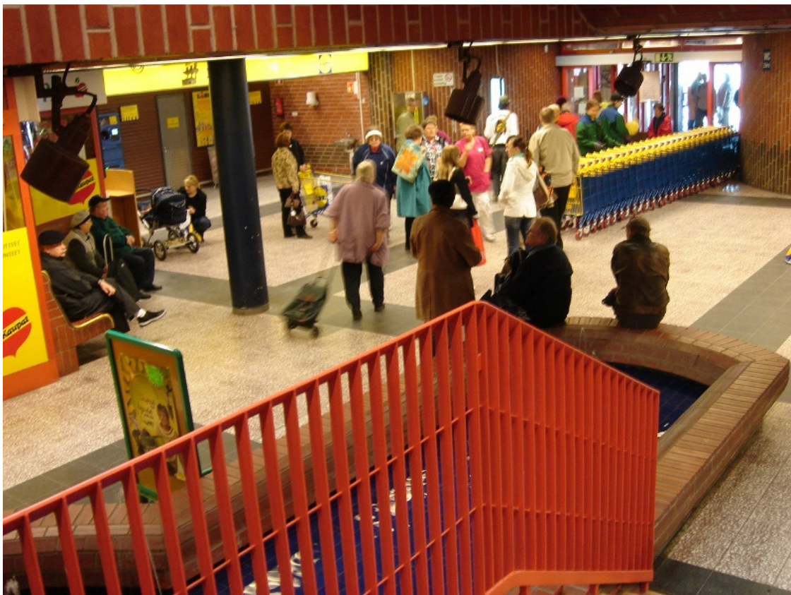
Kuva 2. Kauppakärryjen suma vanhalla pääovella Insinöörinkadun puoleisella pääovella. Vanhan puolen aulan penkeillä istuu useita ihmisiä.

Palaamme kuva-aineiston avulla avajaispäivään huhtikuussa 2007. Laajennusosan avajaiset käynnistyivät kaksi ja puoli tuntia aiemmin. Vanhan, Insinöörinkadun puoleisen, pääoven kohdalle on muodostunut pitkä mutkitteleva kauppakärryjen jono.