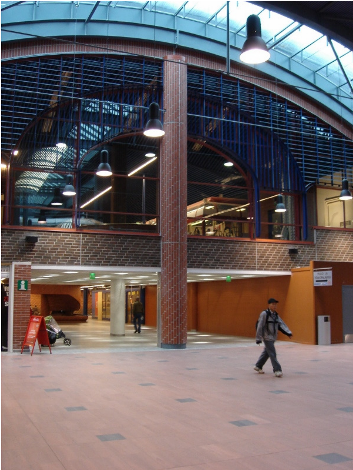
Kuva 4. Vanhan osan entinen itäinen julkisivu, joka on kauppakeskuksen keskusaukion, Talviaukion, koristeellinen vanhaa ja uutta osaa yhdistävä elementti.