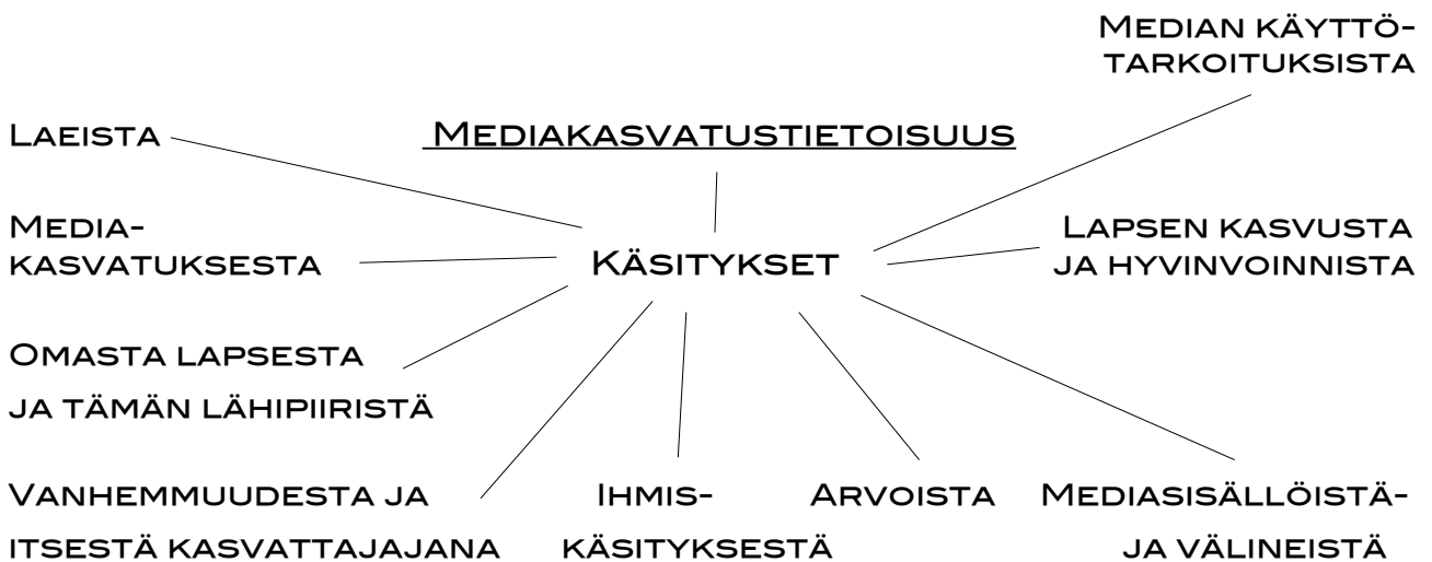
KUVIO 7. Mediakasvatustietoisuuden rakennehahmotelma

Tässä tutkimuksessa vanhempien mediakasvatustietoisuuden rakennetta selvitettiin aineistolähtöisesti. Vanhempien haastattelujen sekä aiemman tutkimuksen pohjalta tämän tutkimuksen tuloksena rakentui hahmotelma mediakasvatustietoisuudesta (kuvio 7.):