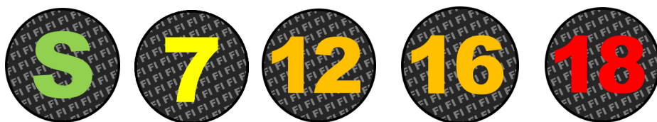
KUVIO 1. Kuvaohjelmien (eli elokuvien, video-, DVD- ja BD -tallenteiden sekä televisio-ohjelmien ja digitaalisten pelien) ikärajat.

Ikärajat kuvaohjelmissä kertovat siitä, että se voi olla haitallinen lapsille. Vaikka jokin kuvaohjelma on kaikille sallittu ohjelma (S), se ei siis välttämättä tarkoita sitä, että ohjelma on lastenohjelma, vaan se kertoo pikemminkin, että ohjelman ei pitäisi olla haitallinen lapsille. (MEKU 2012.) Sisällön perusteella kuvaohjelmalaki vapauttaa mm. opetus-, sivistys-, kulttuuri-, musiikki-, urheilu-, visailu-, harrastus-, keskustelu-, ajankohtais- ja uutisohjelmat sekä suorat lähetykset luokittelulta (Kuvaohjelmalaki 710/2011, 9§).