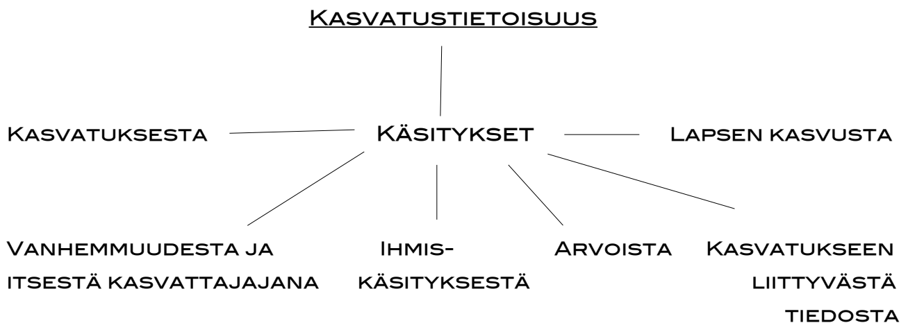
KUVIO 5. Kasvatustietoisuuden sisältö (vrt. Poikolainen 2002, 3; Hirsjärvi 1980, 19–20; Hirsjärvi 1981, 51–52)

Käsitykset syistä, joiden vuoksi rajoja asetetaan, pohjautuvat vanhempien kasvatustietoisuuteen (kuvio 5.). Kasvatustietoisuudella tarkoitetaan vanhempien tietoisuutta omasta toiminnastaan kasvattajina sekä kasvatustoimintaan liittyvistä velvollisuuksista ja oikeuksista. Kasvatustoiminta perustuu vanhempien käsityksiin arvoista ja ihmiskäsityksestä sekä toiminnan tavoitteista, menetelmistä ja tuloksista. Kasvatustietoisuudella viitataan myös kykyyn kasvattaa lapsia kontrolloidusti ja suunnitelmallisesti, mikä edellyttää lapsen kasvun ehtojen ja mahdollisuuksien tiedostamista, jossa otetaan huomioon koko perheyhteisö. (Poikolainen 2002, 11–12, 77–84; Hämäläinen 61–68; Sintonen 2009, 187.)