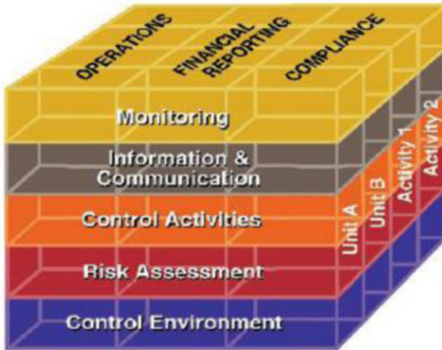
Kuvio 1 COSO-internal control-integrated framework (ugs.edu)

ulkoisen, että sisäisen raportoinnin tehokkuutta. Lain mukaisuus tavoitteilla pyritään saavuttamaan lainsäädännön ja muiden säännösten asettamat vaatimukset. Organisaatiolla voi olla näiden päätavoitteiden lisäksi myös sivutavoitteita. (COSO-viitekehys)