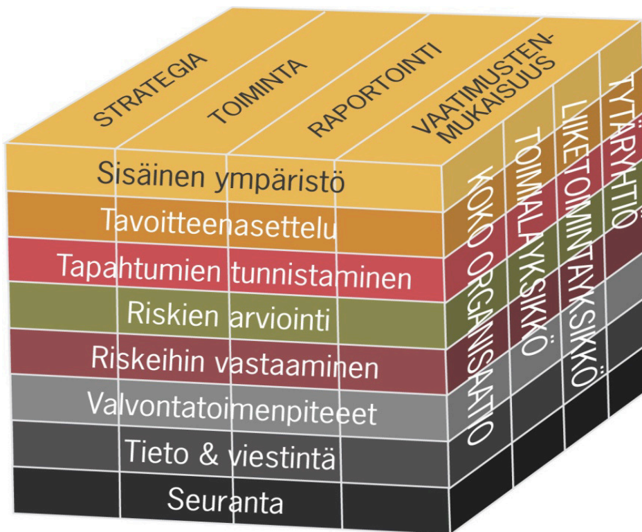
Kuvio 2 COSO-ERM malli (COSO-ERM)

asetteluun. Sitä ei siis voida pitää absoluuttisena. (COSO-ERM) ERM: n hyötyinä voidaan muun muassa pitää seuraavia asioita: tavoitteiden saavuttamisen lisääntyne todennäköisyys, johdon raportoinnin vahvistaminen, riskien ymmärtämisen laajeneminen, johdon toiminnan keskittyminen, riskien ennakoitavuuden parantaminen, ja muutoksien saavuttamisen todennäköisyyden kasvu. (COSO-ERM) Tavoitteina ovat strategiset tavoitteet, eli organisaation toiminnan yleiset tavoitteet, toiminnalliset tavoitteet, jotka liittyvät organisaation taloudellisten resurssien käyttöön, raportointitavoitteet, joiden tarkoituksena on pyrkiä luomaan tehokas raportointijärjestelmä sekä vaatimuksenmukaisuustavoitteet eli toiminnan tulisi täyttää lain ja muiden säännösten vaatimukset.