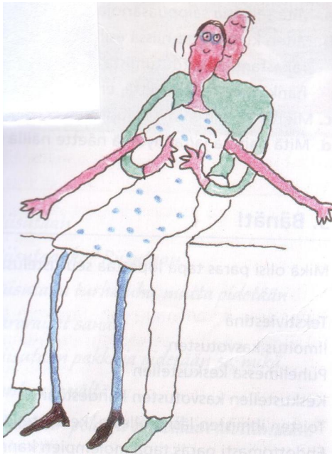
Kuva 3. Mitä tapahtuu? Terveydeksi, 64.

Saman oppikirjan seurustelua käsittelevän luvun lopussa on kaksi pohdintatehtävää, joissa esiintyy seksuaalinen häirintä. Ensimmäinen tehtävä annetaan otsikolla Hyväily tuntui hyvältä, mutta ja siinä pyydetään katsomaan oheista kuvaa ja miettimään, mitä on tapahtunut ja mitä kuvassa tapahtuu sekä kehrittelemään tarina kuvan inspiroimana. Lisäksi tehtävässä ohjeistetaan pohtimaan tytön ja pojan ajatuksia ja tunteita.