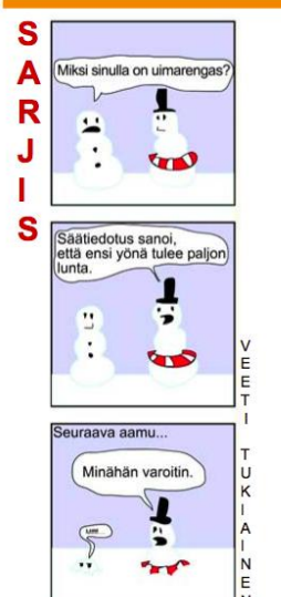
Kuva 6. Keskisuomalaisen nuorten sivu 23.2.2011.

aiheksia elämään, ja tereytti hyvää ruokaa! Ilat kuitaan tekemällä lätkeyä, näkemällä kaaverit, olemalla kotona, kuntolamella erian kantaolin ryhmäpöytä, käymällä teatteritreenissä, kaksosella leijota, käymällä paikallispuuissa, milloin mitäänkin. Joka ita soitin vanhemmilleni, joskun myös siskolleni. Kerroin koulunsaajan ja he kerroivat, miten Jyväskylässä minne. He ovat minulle todella tärkeitä ja onkin mukavaa kaitella heidän äänensä. Nykyisin eniten vaihtoehtoa van harvoin, ennen läheskään joka päivä kaiten ennen. ALIN PERIN oli puhe, että paitaan kottoutui (sitä kottui Jyväskylässä) joka viikkomppu. Tosin on kuitenkin käyty, sillä ova viikkomppuista kaita harrastustien parissa. Se on huijaa ikävä, mutta ole valmis luopumaan harrastustilankaan, joskun ikävintä perheistä kovasti. Onneksi puhelimet ja netti on keksitty, eikä junaikkakaan kovin kaita kaita. Muutamaan kerran olen käynyt Jyväskylässä jossa kesken nauttikoon. Loppujen lopuksi, olen varma, että janssa tapurantti luopumista tulla Tampereen yhteiskoulun lukiossa. * Kirjoittaja opiskelurastinmistä tulla Tampereen yhteiskoulun lukiossa.