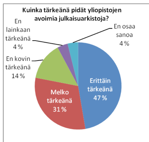
Kuvio 2. Yliopistojen avointen julkaisuarkistojen tärkeys (N=205)

Tampereen yliopiston tutkijoista 78 prosenttia pitää yliopistojen omia julkaisuarkistoja joko melko tai erittäin tärkeänä. Erittäin tärkeänä arkistoja piti melkein puolet vastaajista, 47 prosenttia, ja melko tärkeänä 31 prosenttia (ks. kuvio 2). 14 prosenttia vastaajista oli sitä mieltä, etteivät arkistot ole kovin tärkeitä, 4 prosenttia ei pitänyt arkistoja lainkaan tärkeänä ja 4 prosenttia vastaajista ei osannut sanoa kantaansa asiaan.