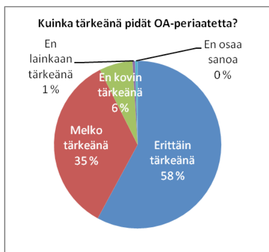
Kuvio 1. Open Access -periaatteen tärkeys (N=205)

Lähes kaikki Tampereen yliopiston kyselyyn vastanneet pitivät Open Access -periaatetta joko erittäin tai melko tärkeänä. Erittäin tärkeänä sitä piti 58 prosenttia vastaajista ja 35 prosenttia melko tärkeänä (ks. kuvio 1). 6 prosenttia vastaajista ei pitänyt OA-periaatetta kovin tärkeänä ja yksi prosentti vastaajista ei pitänyt sitä lainkaan tärkeänä.