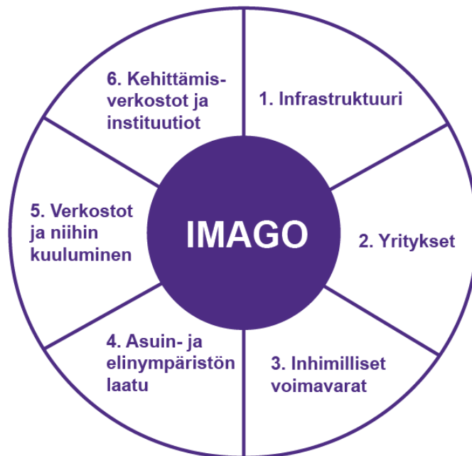
Kuvio 1. Alueellisen kilpailukyvyyn kahdeksan elementtiä (mukaillen Linnamaa, Sotarauta & Mustikkamäki 2001)

Ensimmäinen elementti on infrastrukturi. Sillä tarkoitetaan kunnan kaikkia infrastruktuuriin liittyviä toimintoja, kuten liikenneyhteyksiä, kaavoitusta sekä alueen toimitiloja. Myös esimerkiksi energian ja luonnonvarojen saanti lasketaan tähän kategoriaan. (Linnamaa, Sotarauta & Mustikkamäki 2001, 15.)