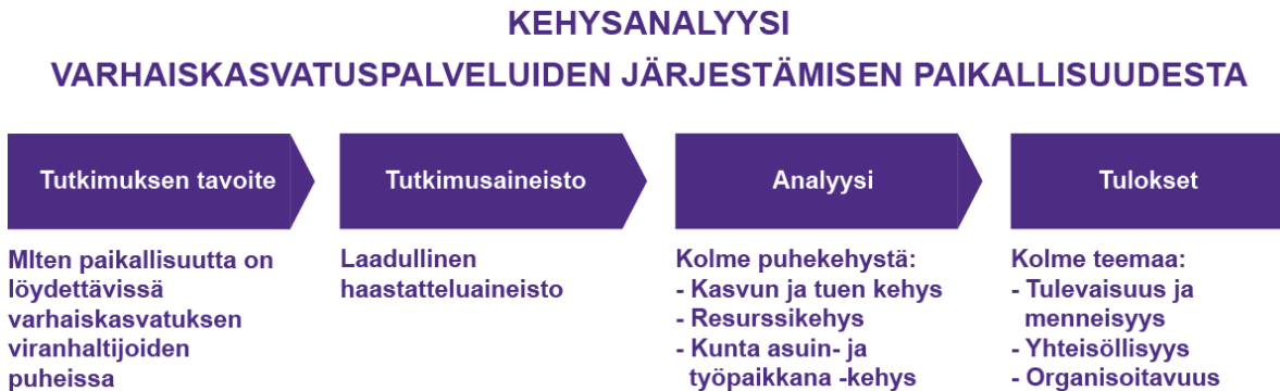
Kuvio 4. Tutkimusprosessin kuvaus

Luvussa seitsemän linjataan yhteenvetona tutkimustulokset. Tässä tutkimuksessa tarkasteltiin paikallisuutta varhaiskasvatuspalveluiden järjestämisen näkökulmasta. Kuvio 4. esittelee tutkimusprosessin ja tutkimustulokset yksinkertaistettuna.