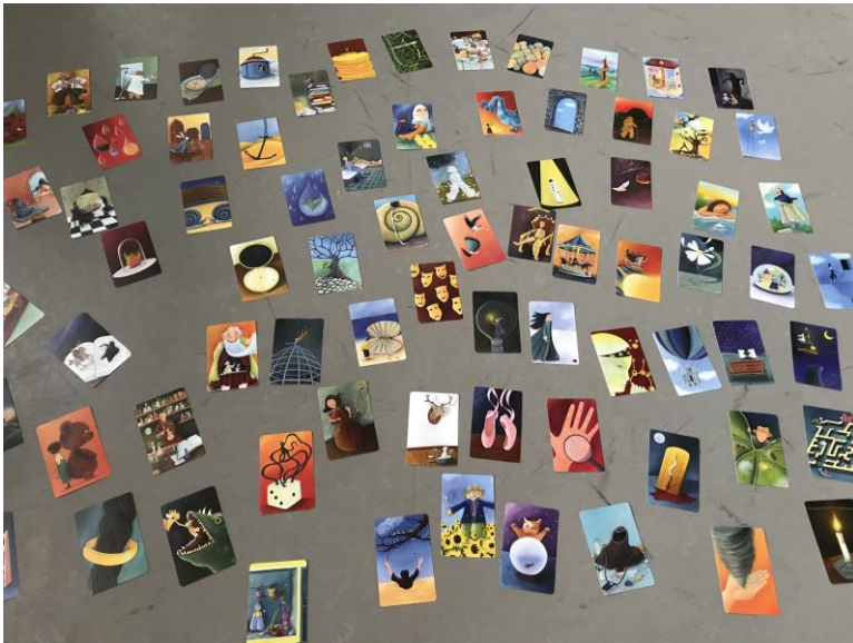
KUVIO 1. ”Tärkeä aihe” - liiketehtävässä käytetyt kuvakortit

Käsittelyosion ensimmäisen liiketehtävän ”Tärkeä aihe” taustalla oli kysymys ”Millaista apua ja tukea olet saanut?” Tarpeeksi avoimen, mutta rajatun kysymyksen tarkoituksena oli turvata mahdollisesti traumatisoitunutta nuorta tilanteelta, jossa hän saattaisi ajautua hallitsemattomaan tunteen purkaukseen. Osallistujat valitsivat yhden itse tärkeäksi kokemansa aiheen, johon he olivat saaneet apua ja tukea palvelusta, sekä tätä aihetta kuvaavan kuvakortin lattialle levitetyistä lukuisista erilaisista kuvakorteista (kuvio 1). Kortin he sijoittivat valitsemaansa paikkaan tanssisalissa.