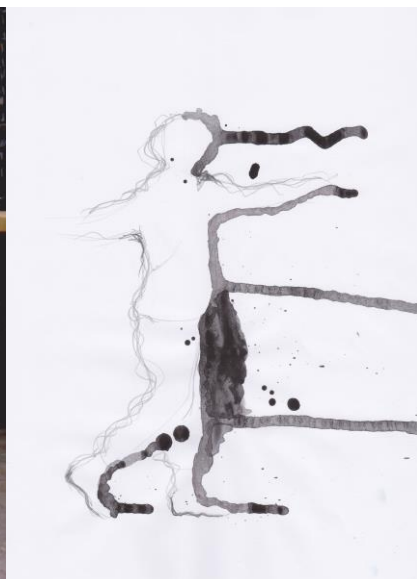
KUVIO 4. Nuoren 1 elämäntilanne: Liiketehtävä "Unelmien palvelu"