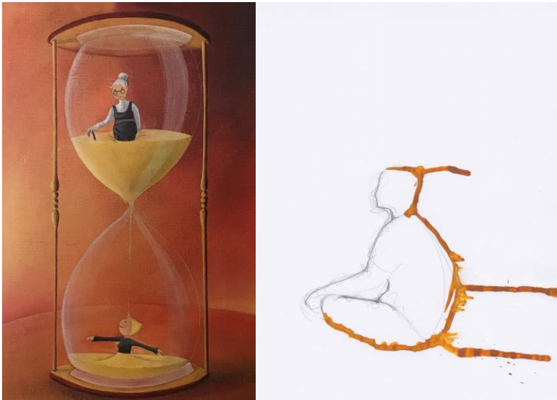
KUVIO 5. Nuoren 2 elämäntilanne: Liiketehtävä ”Tärkeä aihe”

Kolmen minuutin kuluttua nuori nousi ylös, vaihtoi paikkaa muutamalla askeleella ja laskeutui takaisin lattialle selälleen. Hän nosti polvet rintakehäänsä vasten ja rullasi selkäänsä lattiaan. Tämän jälkeen hän kohdisti hartioiden ja niskan alueelle venyttäviä, avaavia ja kiertyviä liikkeitä, sekä istuen että seisten. Lopuksi nuori nousi jälleen ylös ja alkoi tutkia tilaa ja tilassa olevia ilmankostuttimia. Hän hakeutui toisen nuoren luokse, jolloin myös liiketehtävä tuli päätökseensä.