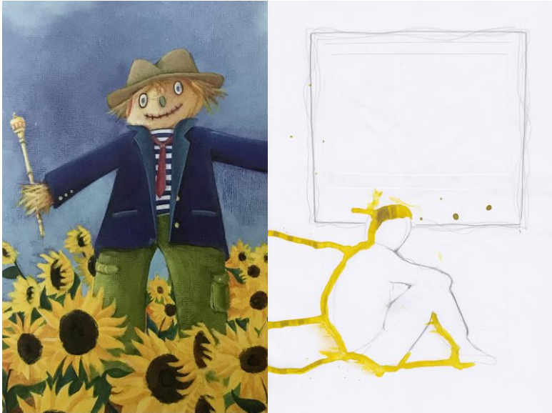
KUVIO 3. Nuoren 1 elämäntilanne: Liiketehtävä ”Tärkeä aihe”

Liiketehtävän aikana havainnoin nuoren mielentilaa, ja varmistin heti liiketehtävän lopussa, että hän voi hyvin. Nuori vastasi minulle naurulla ja ilmaisi itseään fyysisesti asettumalla lattialle selinmakuulle kaikki raajat levällään joogasta tuttuun savasanaan eli ”kuolleen asentoon”. Tulkitsen nuoren esittäneen asentonsa kautta rentoutumista, johon viittaan seuraavassa työpajassa käydyssä purkukeskustelussa: