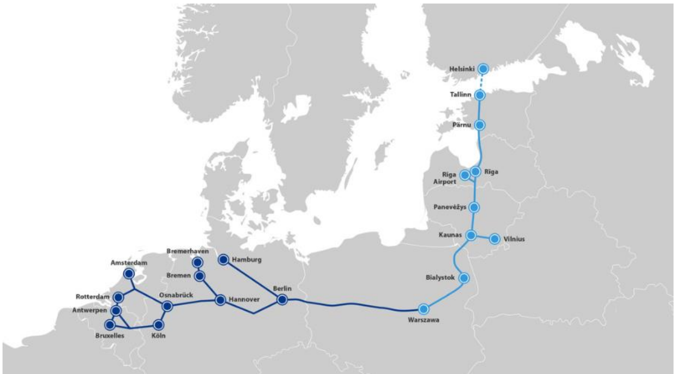
Kuva 1. Rail Baltica vaaleansinisellä (Bartosiewicz & Szterlik 2020, 56).

Projektipohjaisesta Euregio mallista siirryttiin kaupunkien määritelmiin ”kärkihankkeisiin” ja pormestarien koordinoimaan kaupunkien väliseen yhteistyöhön. (Helsingin ja Tallinnan kaupunki 2022) 2018 yhteistyösopimuksen allekirjoittamistilaisuudessa pormestarit painottivat yhteistyötä turismin kehittämisen, Itämeren suojelemisen sekä yhteisen kansainvälisen markkinoinnin osalta (Helsingin kaupunki 2018). Kaksoiskaupunki konsepti oli kansallisen huomion alla FinEst Link -loppuraportin valmistumisen takia 2018. Euregio aikana 2012 valmistui ensimmäisiä selvityksiä Helsingin ja Tallinnan välisestä tunnelista. Molemmat herättivät valmistumisaikanaan kansallista mediahuomiota. Tunnelihanke itsessään liittyy EU:n Rail Baltica -projektiin, jonka tavoitteena on luoda nopea rautatieyhteys Varsovasta Tallinnaan. Helsinki-Tallinna tunneli olisi junayhteyden jatkamista Helsinkiin asti. Hankkeiden toteutuessa Suomi ja Viro eivät olisi enää EU:n periferia-aluetta parin tunnin junayhteyden ansiosta Euroopan ytimeen (Demos Helsinki).