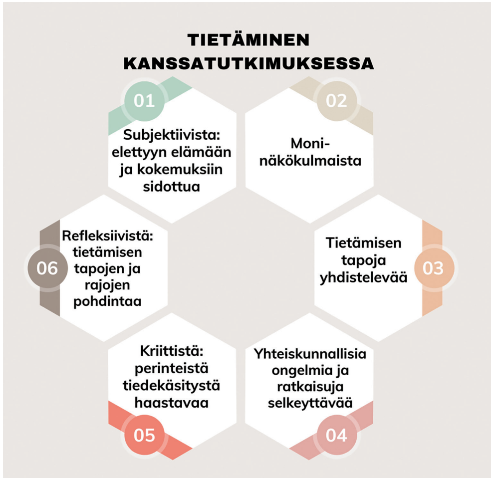
Kuvio 4. Tietäminen kanssatutkimuksessa.

sellaista tietoa, jota voidaan hyödyntää eriarvoisuuksien näkyväksi tekemiseen ja purkamiseen. Kanssatutkimus voi kuitenkin yhtä hyvin pohjautua yllä kuvaamaamme tulkinnalliseen (Ryan 2018) tiedonintressiin, jolloin päällimmäisenä tiedon tuottamisen tavoitteena on erilaisten kokemusmaailmojen syvälinen ymmärtäminen. Kuten luvun alussa totesimme, myös positivismiin pohjautuvaa kanssatutkimusta tehdään.