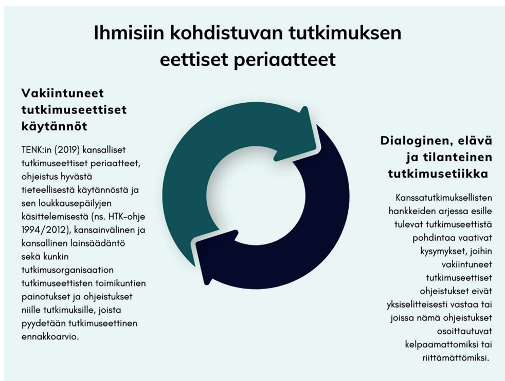
Kuvio 9. Ihmisiin kohdistuvan tutkimuksen eettiset periaatteet.

Käytämme tässä luvussa käsitteitä vakiintuneet tutkimuseettiset käytännöt ja dialoginen, elävä ja tilanteinen tutkimusetiikka kuvaamaan niitä eettisiä orientaatioita, joiden ristivedossa ammatittutkijat toteuttavat kanssatutkimuksellisia hankkeita (ks. Kuvio 9. Ihmisiin kohdistuvan tutkimuksen eettiset periaatteet).