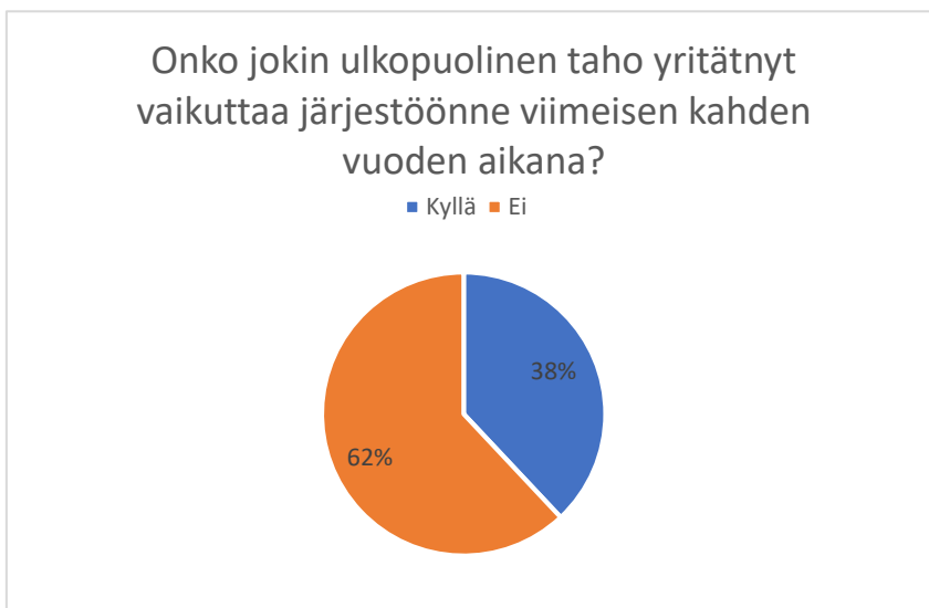
Taulukko 8: Onko jokin toimituksen ulkopuolinen taho yrittänyt vaikuttaa lehteenne viimeisen kahden vuoden aikana? (n=66)

Vaikutusyritysten yleisyyttä selvitettiin yksivalintakysymyksellä, jossa vastaajia pyydettiin arvioimaan, kuinka paljon vaikutusyrityksiä on koettu keskimäärin kahden