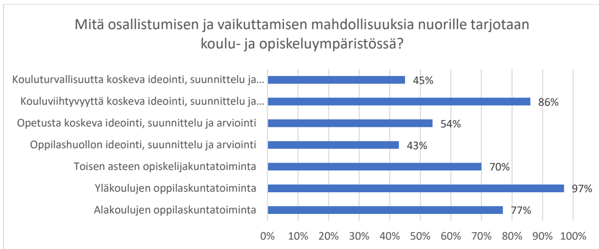
Kuvio 1. Nuorten osallistuminen ja vaikuttaminen kouluympäristössä aluehallintovirastojen peruspalvelujen arvioinnin 2017 mukaan (Suomen nuorisotyön tilastot 2020).

Kouluympäristö on yksi merkittävimmistä ympäristöistä nuoren elämässä, jossa opitaan demokratiasta, politiikasta sekä kansalaisuudesta ja opetellaan osallistumisen käytäntöjä. Vaikka koulu nähdään yleisesti paikkana, jossa rohkaistaan ja opetetaan nuoria osallistumaan, voi kouluympäristö näyttäytyä nuorelle jopa haastavana osallistumisen ympäristönä. Kouluympäristössä vallitsee vallan epätasapaino aikuisten ja koululaisten välillä. Aikuisten määrittelemät säännöt sekä heidän ylläpitämänsä kontrolli rajaavat nuorten osallistumisen mahdollisuuksia. Osallistumisen tapojen kouluissa on sanottu imitoivan aikuisten poliittisen osallistumisen tapoja. Imitoinnin tarkoituksena voidaankin tulkita olevan valmistautuminen tulevaisuudessa hämmöttävään, aikuisuuden aktiiviseen osallistumiseen kansaliskasvatuksellisin keinoin. Tällöin nuoret nähdään pikemminkin tulevaisuuden osallistujina sen sijaan, että heidät nähtäisiin osallistuvina ja kykenevinä yksilöinä tässä ja nyt. (Wood 2012, 337.)