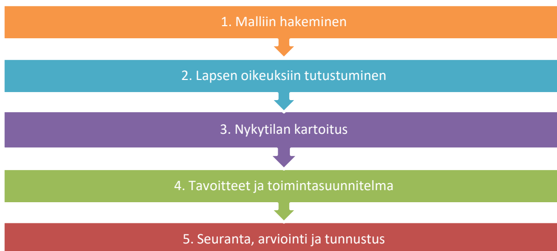
KUVIO 2. Lapsiystävällinen kunta -malliin kuuluvat vaiheet. Kuvio on luotu UNICEFin digipalvelun sivun pohjalta, jossa on esitelty vaiheet.

Suomen kontekstiin tehty malli seuraa paljolti UNICEFin yleistä mallia, jota sovelletaan myös muiden maiden kontekstissa. Huomionarvoinen ero on se, että Suomen malliin on lisätty lapsen oikeuksiin tutustumisen vaihe. Tässäkin mallin vaiheet etenevät järjestyksessä alkaen ensimmäisestä vaiheesta. Seuraavaksi Suomen kontekstissa olevan mallin vaiheita avataan hieman tarkemmin mutta tiivistetysti, mikä voi auttaa hahmottamaan mallia kokonaisuutena. Digipalvelun (UNICEF 2021a) sivuilla ensimmäisenä vaiheena on malliin hakeminen, joka sisältää malliin ja hakuprosessiin tutustumisen, kunnanhallituksen päätöksen tekemisen malliin hakemisesta ja hakulomakkeen täyttämisen. Kunnan tullessa hyväksytyksi UNICEF ja kunta sitoutuvat yhteistyöhön. Tällöin alkaa mallin toinen vaihe eli lapsen oikeuksiin tutustuminen, johon kuuluu alkukoulutus. Siinä tarkastellaan sitä, mitä lapsen oikeudet kunnan päätöksenteossa ja arjen tasolla tarkoittavat sekä miten malli edistää niitä. Lisäksi toiseen vaiheeseen kuuluu teemapaketteja, jotka tarjoavat pohjatietoa mallin työstämiseen kunnassa. Teemapakettien aiheina ovat johdanto lapsen oikeuksiin, yhdenvertaisuus, lapsen etu, oikeus elämään ja kehittymiseen sekä osallisuus. Kolmantena vaiheena on nykytilan kartoitus, jonka tarkoituksena on arvioida kunnan lapsiystävällisyyden ja lapsen oikeuksien toteutumista kunnassa. Nykytilan kartoitus koostuu kolmesta vaiheesta, jotka ovat lasten näkemykset, rakenne- ja prosessi-indikaattorit sekä