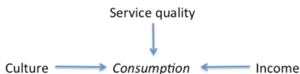
Kuva 1. Käsitteellinen malli kulutukseen vaikuttavista tekijöistä (mukailtu lähteestä Heryanto 2010, s. 371).

Tässä tapauksessa työn laatija on muokannut lähteen kuvaa otaksuttavasti paremmin omiin tarpeisiinsa tai mieltymyksiinsä sopivaksi. Koska kyseessä on lainaus – ilmiäsu on muokattu mutta viitekehys itsessään on sama – täytyy tämä tuoda esiin. Työn laatija on tehnyt tämän lähdeviitettä edeltävällä ilmaisulla ”muokattu lähteestä”.