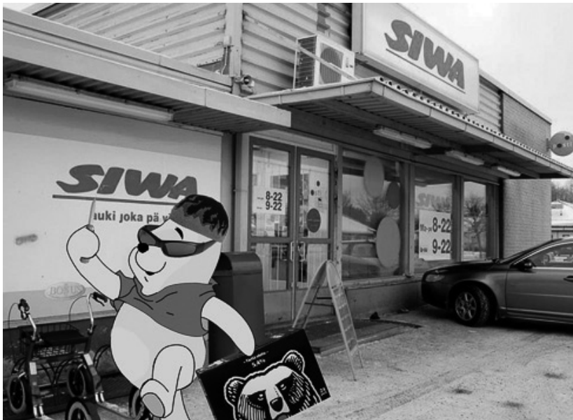
Kuva 2. Liekkipipo ja pirikiikarit -meemin variaatio.

voisko_joku_selittaa> (linkki tarkistettu 21.9.2015).