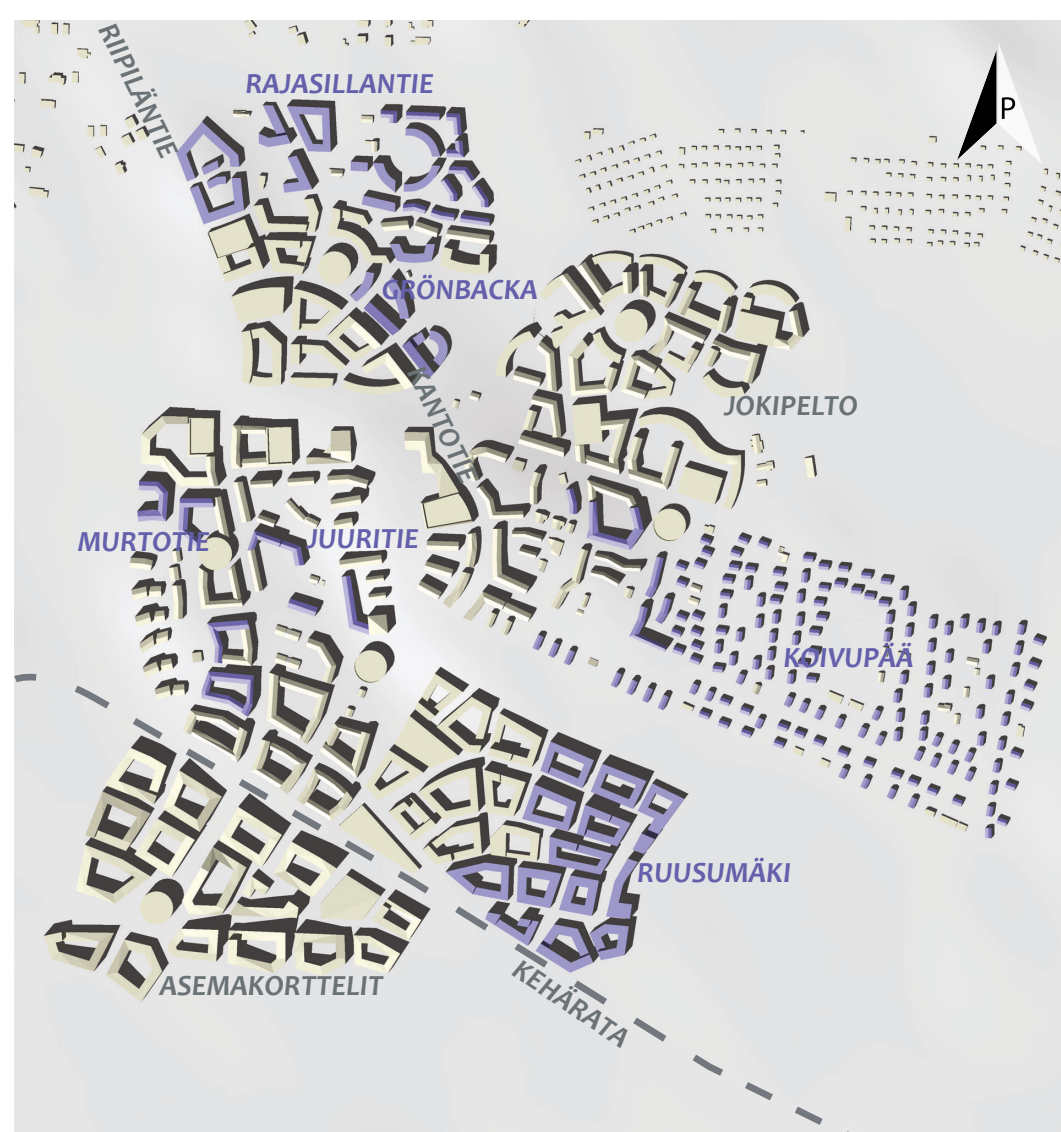
Kolmas suunnitelmavaihe 1 : 10000.