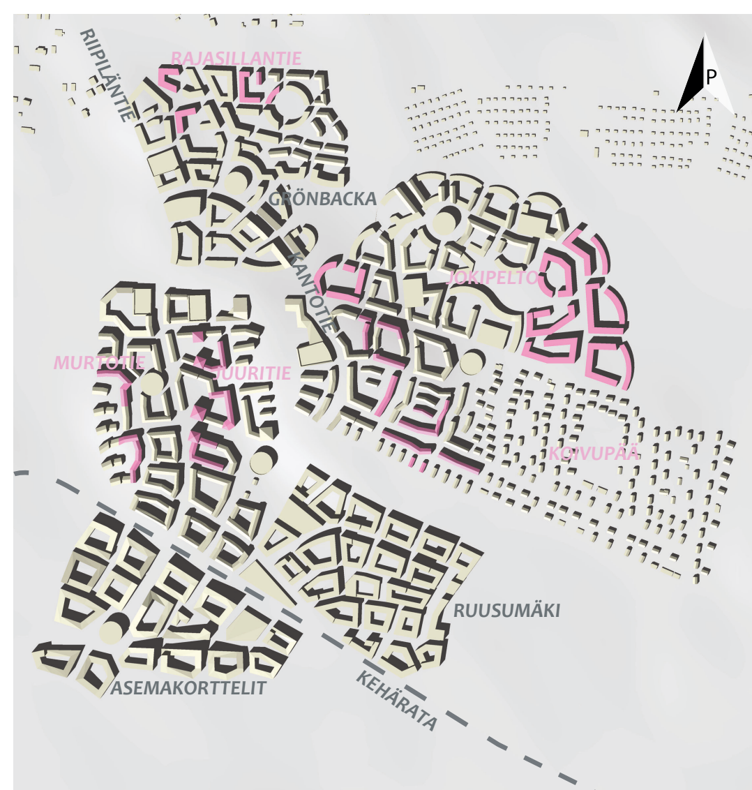
Neljäs suunnitelmavaihe 1 : 10000.