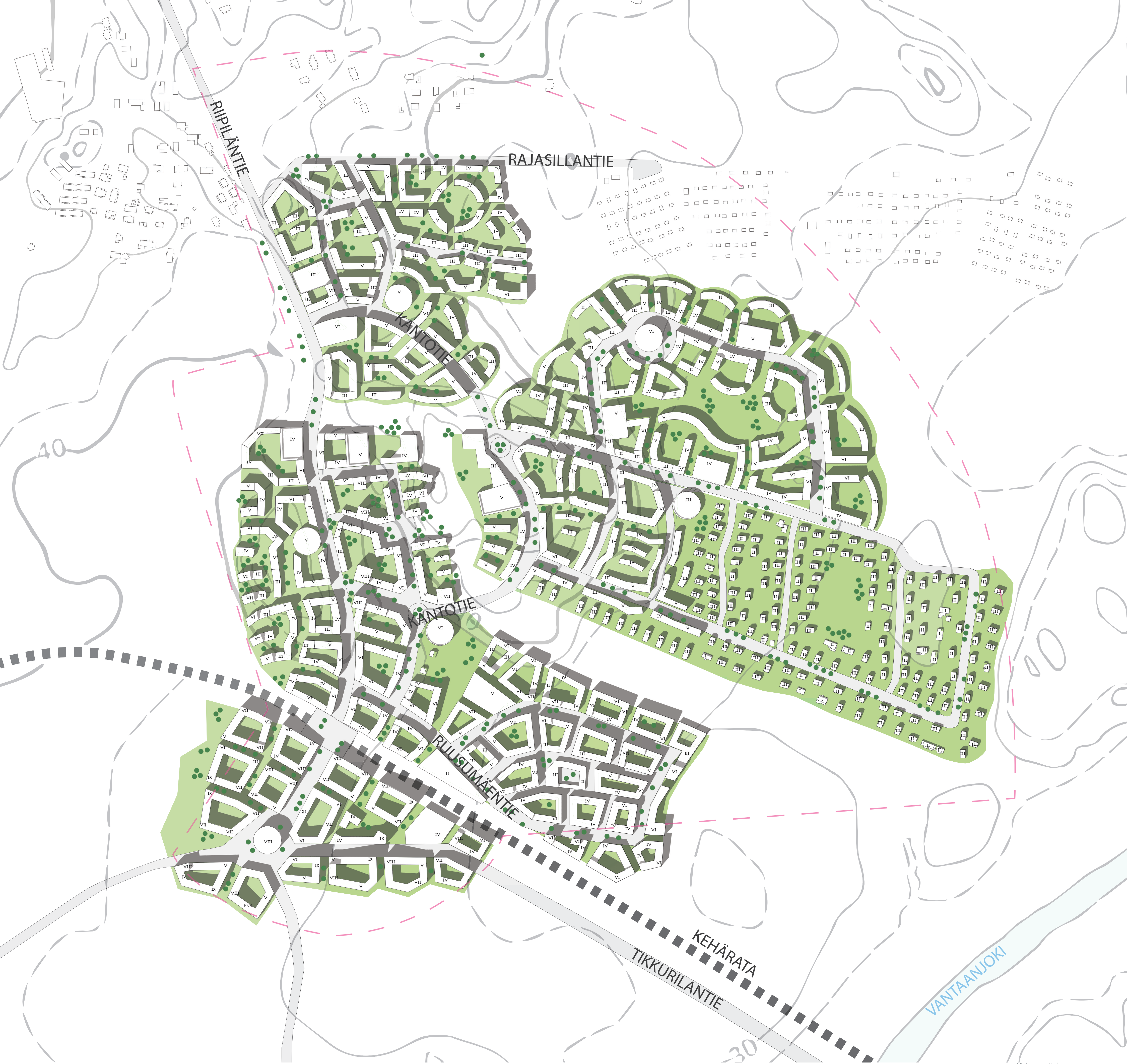
Yleissuunnitelma 1 : 3000.